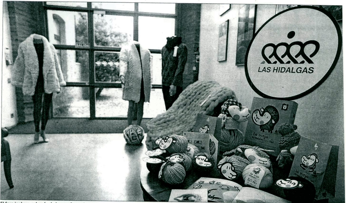
El foro incluye, además de las conferencias, una exposición y un cuentacuentos y taller infantil. RAMIRO

El Ayuntamiento promueve en los colegios el aprendizaje del lenguaje inclusivo