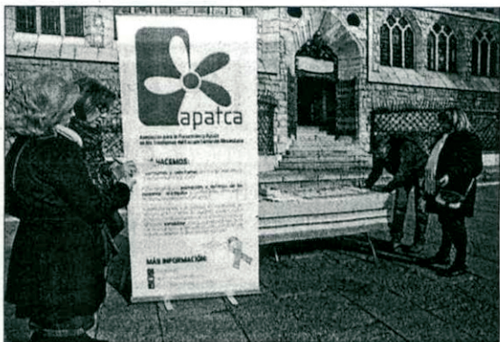
F. OTERO PERANDONES

El Corte Inglés de León pone a disposición de sus clientes hasta el próximo 22 de marzo la Feria de Alimentos de Europa, un espacio de más de 200 metros cuadrados ubicado en el exterior del supermercado, donde se podrán encontrar más de 2.000 productos de los más representativos de cada uno de los países del viejo continente, desde vinos franceses, griegos o italianos, hasta quesos, cervezas alemanas o belgas, la más amplia variedad de dulces, quesos, salchichas y chacinias, pastas, conservas o también productos frescos, como el salmón noruego directamente llegado desde los fiordos, o el exclusivo bacalao skrei, el «pata negra» del mar. | DL