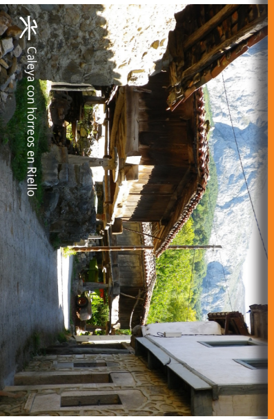
Caleyá con hórreos en Riello