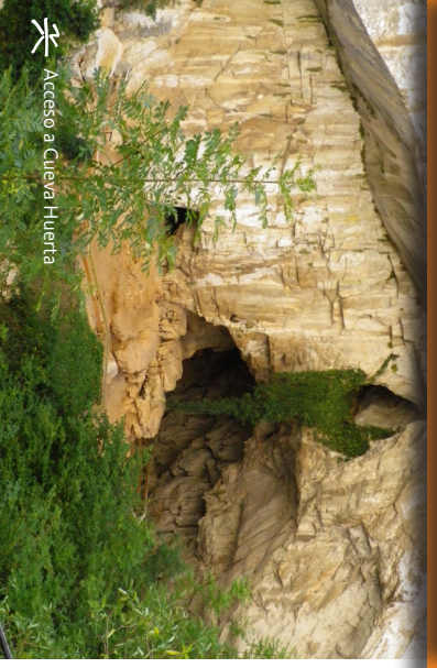
Acceso a Cueva Huerta