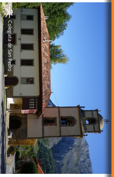
Colegiata de San Pedro

Se trata de una impresionante cavidad situada en Fresnedo (Teverga), de interés hidrogeológico y biológico, que fue declarada Monumento Natural en 2002. Su colina de mruclélagos de cueva ha sido catalogada de Interés Especial y de Interés Comunitario. Es actualmente la segunda cavidad asturiana por el desarrollo total de sus galerías (14,5 km) y forma parte de un conjunto cárstico singular, compuesto por un desfiladero, sumidero, gran cueva, diversos cauces subterráneos y resurgencia.