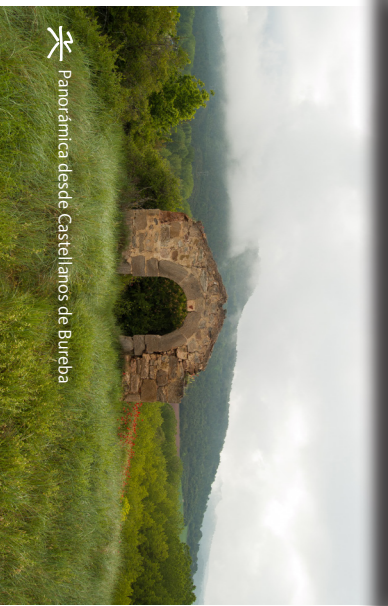
Panorámica desde Castellanos de Bureba