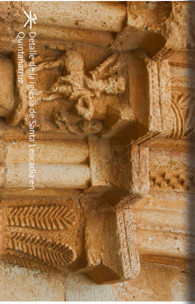
Detalle de la iglesia de Santa Leocadia en Quintanarroz

Localidad burgalesa que como hace entrever su denominación tiene su historia ligada a la explotación salinera. Vestigios de asentamientos neolíticos ya hacen sospechar una rudimentaria extracción de la sal. Romanos, visigodos y musulmanes perfeccionarían la recogida de esta valiosa sustancia utilizada para la conservación de los alimentos. Del esplendor del siglo XVIII datan la Casa de Administración de las Reales Salinas y los almacenes de La Magdalena y Trascastro. Presenta un riquísimo patrimonio arquitectónico declarado Bien de Interés Cultural, como El casco antiguo de la villa, el Castillo de los Rojas, las salinas y la iglesia de San Cosme y San Damián, patronos del municipio cuyas fiestas se celebran del 26 al 29 de septiembre. Su vecino más ilustre es el inolvidable Félix Rodríguez de la Fuente.