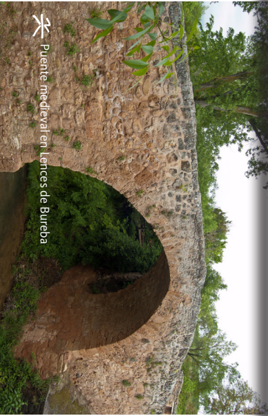
Puente medieval en Lences de Bureba