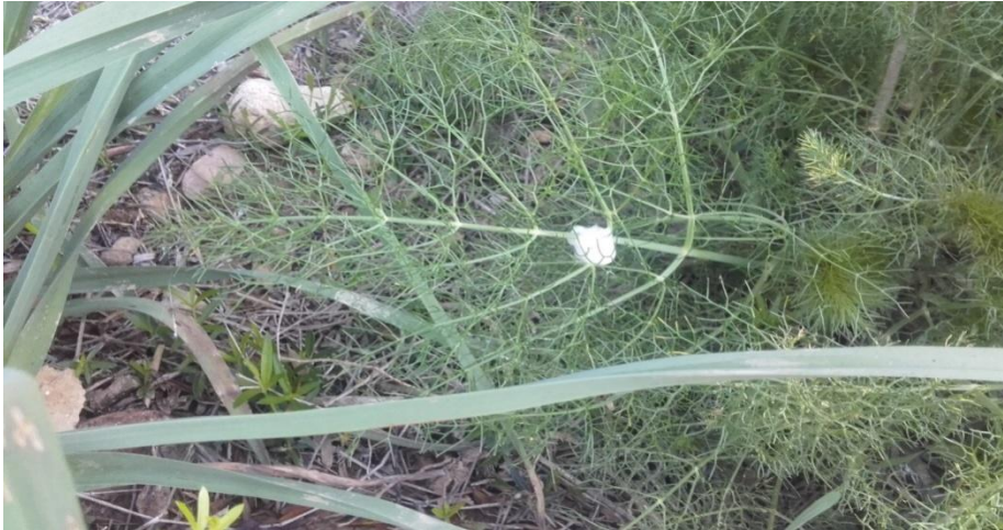
Ninfa de Philaenus spumarius en vegetación adventicia

Tras las observaciones en campo, se ha detectado en las Illes Balears , que la actividad de las ninfas comienza a partir del mes de marzo.