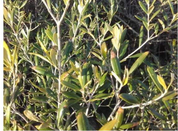
Sintomatología en Olea europaea .