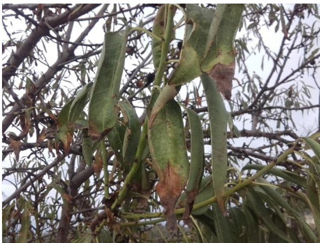
Sintomatología en Prunus dulcis .