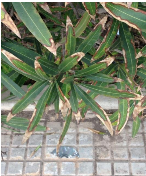
Sintomatología en Nerium oleander

La bacteria afecta a numerosas especies vegetales tanto herbáceas como leñosas. En la página web de sanidad vegetal se puede consultar la relación actualizada y publicada por la UE, de plantas hospedantes de Xylella fastidiosa ( http://www.caib.es/sites/sanitatvegetal/ca/llistat_de_plantes_hospedants_de_xylella_f_astidiosa_a_europa/ )