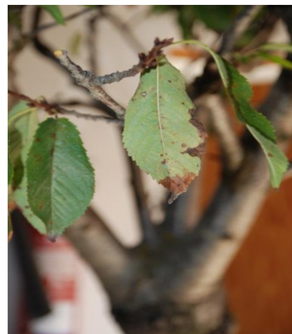
Sintomatología en Prunus avium .