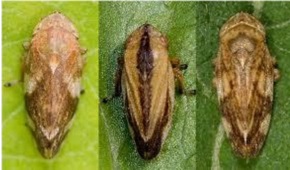
Philaenus spumarius . Estadio adulto

Cuando chupan de una planta infectada, mantienen en su aparato bucal la savia donde también se encuentra la bacteria. Al desplazarse a una planta sana y picar en ella, se produce la infección ya que el vector inyecta el inóculo mezclado con sus propios jugos.