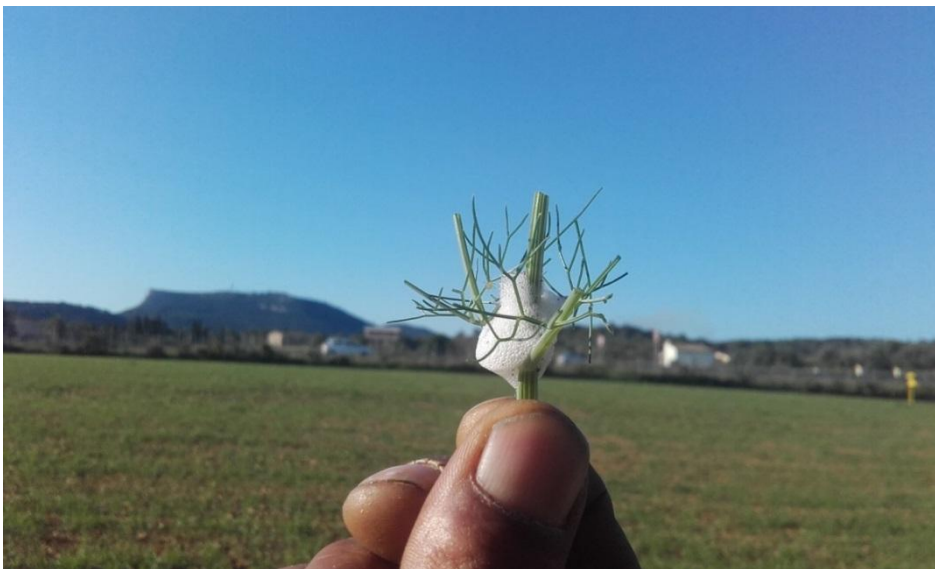
Espuma que le sirve de protección a la ninfa de P. spumarius