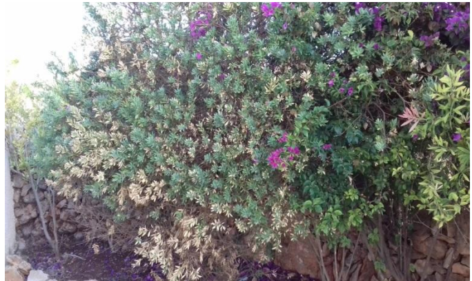
Sintomatología en Polygala .