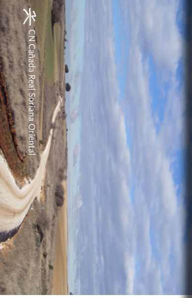
CN Cañada Real Soriana Oriental