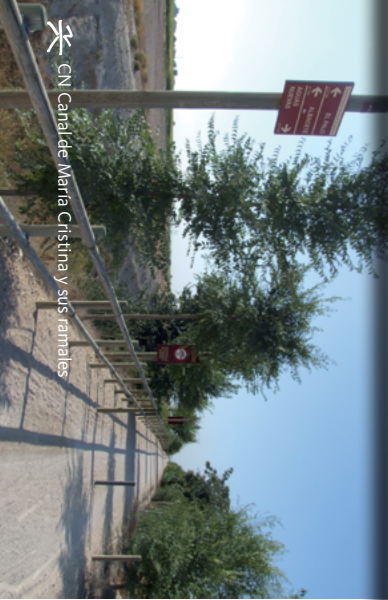
CN Cañada Real Soriana y sus ramales