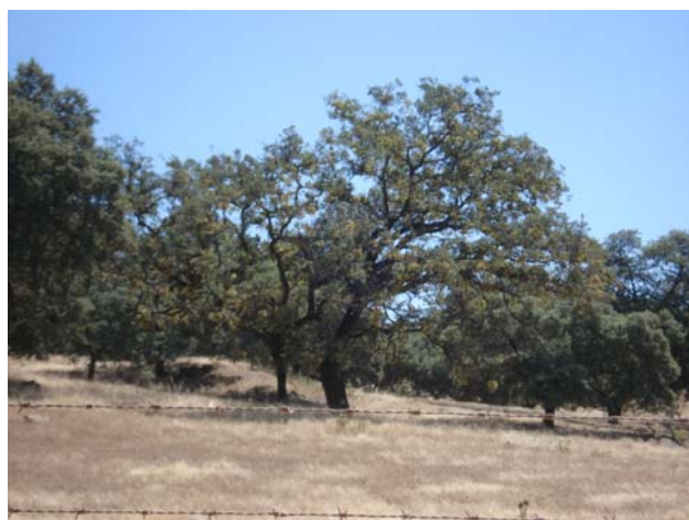
Encina con ramillos afectados por T. kruchii .

Los síntomas se aprecian tras la brotación, el patógeno estimula la producción de yemas durmientes. Las ramas afectadas presentan numerosas hojas pequeñas, o a veces más grandes, pero siempre más claras que el resto del follaje. Los ramillos son más cortos y gruesos de lo normal y erectos. El árbol es incapaz de mantener la vascularización en estas ramas, las hojas se marchitan y caen. La caída de las hojas deja a la vista la proliferación de ramillos a las que se debe el nombre común de la enfermedad, "escoba de brujas".