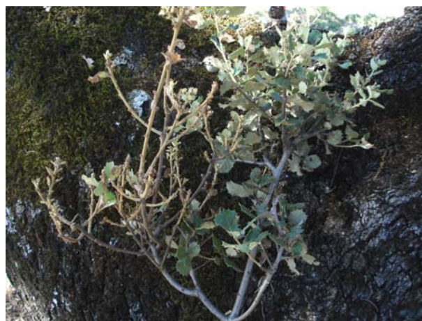
Escoba de bruja.