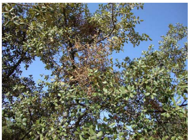
Ramillos con defoliación.