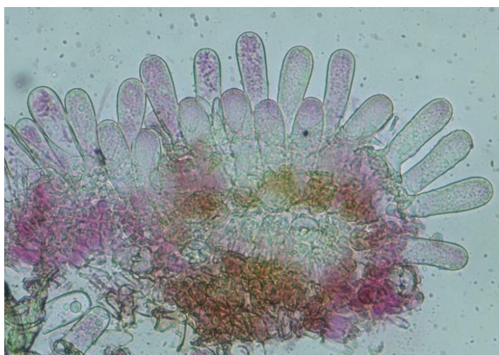
Ascas desnudas en empalizada.