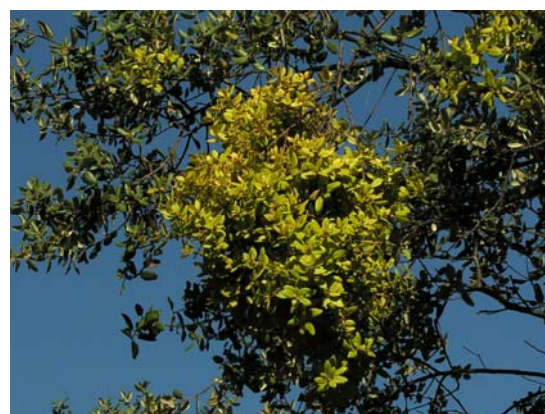
Ramillos con numerosas hojas amarillentas.