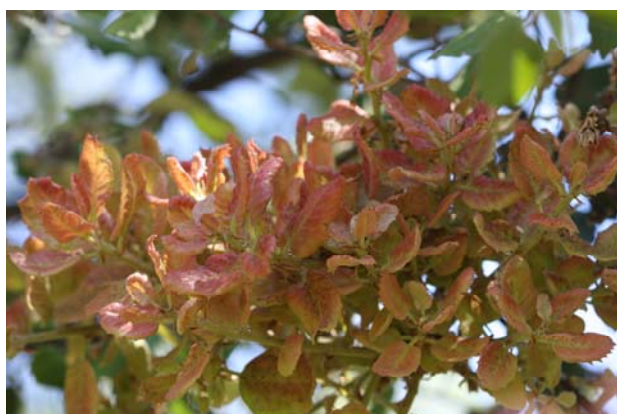
Brotos con hojas rojizas.