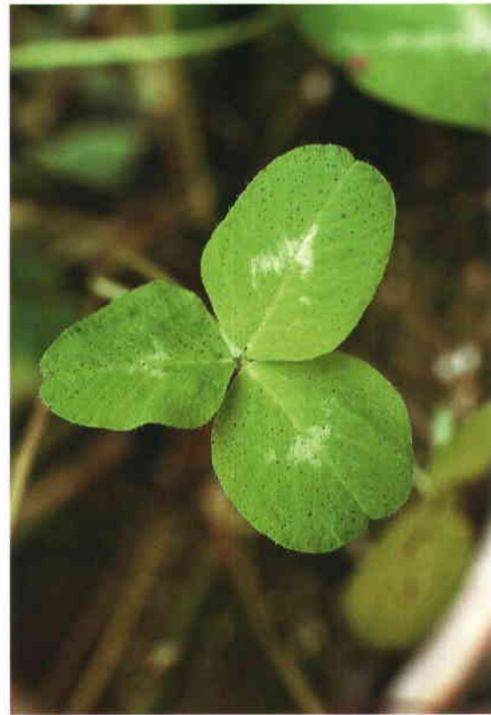
Manchas foliares en trébol violeta