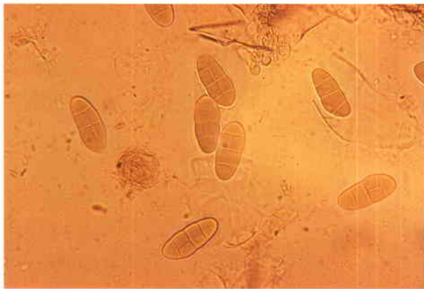
Ascosporas muriformes (128 x) en trébol blanco