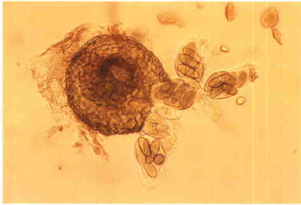
Periteca con ascas (63 x) en trébol blanco.