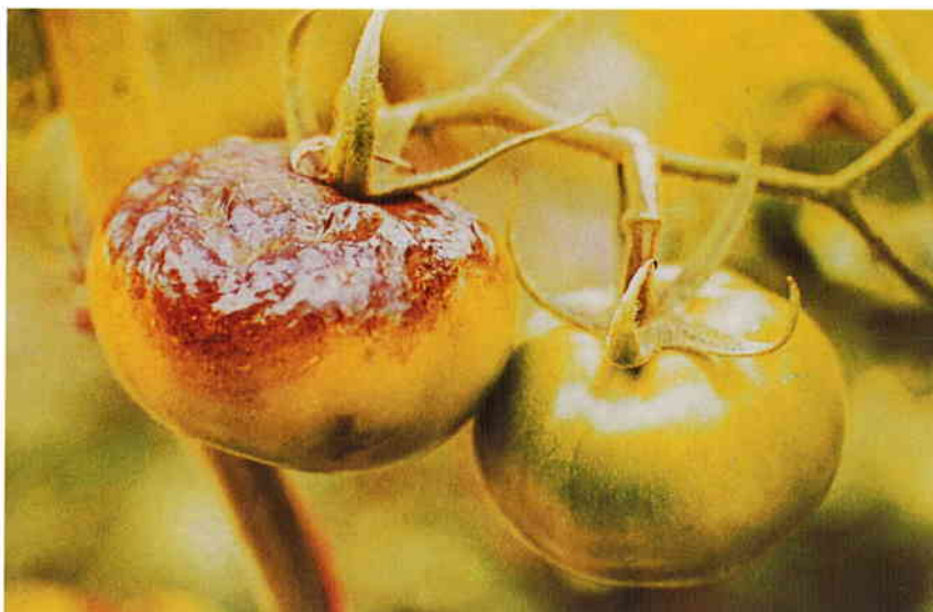
Síntomas producidos por un ataque de P. Infestans sobre tomate.

Manchas pequeñas de color verde claro o verde oscuro, de forma irregular. Bajo condiciones ambientales favorables, las lesiones progresan convirtiéndose en lesiones necróticas grandes de color castaño a negro, que pueden causar la muerte de los folíolos y diseminarse por los peciolo hasta el tallo. Bajo condiciones favorables se forma un halo blanquecino en el borde de las lesiones constituido por esporangios y esporangioforos, especialmente en la cara inferior de las hojas. Los tubérculos de patata presentan áreas irregulares ligeramente hundidas. Interiormente presentan pudrición granular seca de color canela-castaño. En tomate, la zona afectada se oscurece, toma apariencia irregular y desarrolla podredumbre rápidamente.