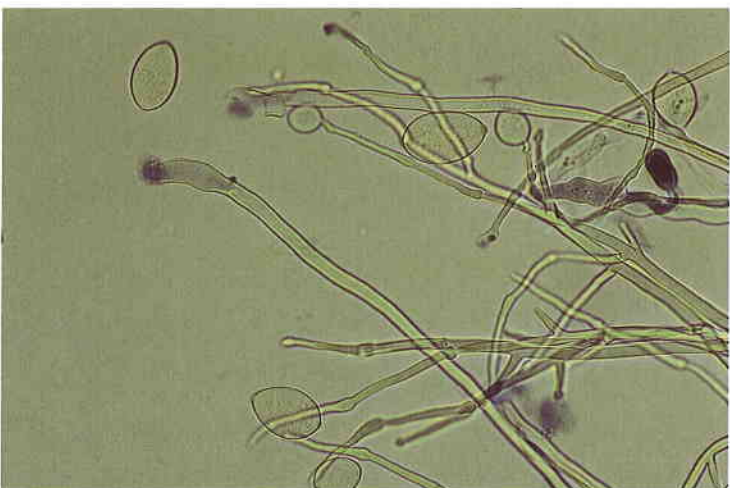
Esporangios y esporangioforos de P. infestans.

En cinco días se obtiene un micelio blanco algodonoso que es recogido con la punta de un escalpelo y colocado sobre Agar V8(300 ml jugo 8 vegetales + 4,23 g carbonato cálcico + 20 g Agar + agua destilada hasta 1 l) con antibióticos (10 mg Pimaricin + 200 mg Vancomyein + 100 mg Pentachloronitrobenzeno).