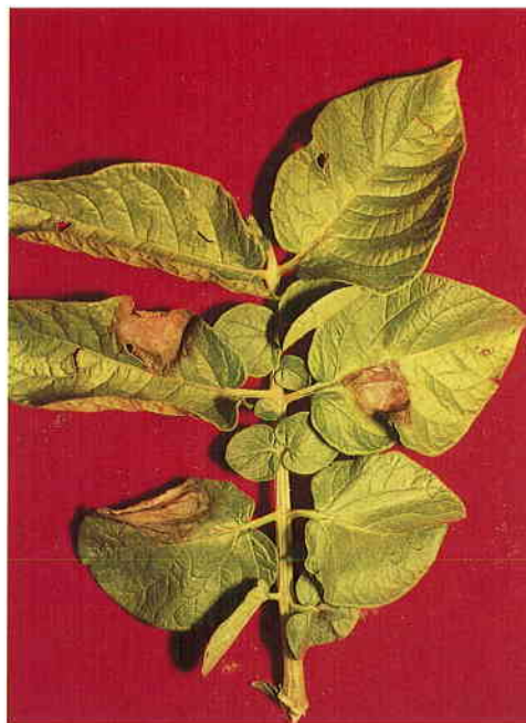
Síntomas foliares de mildiu en patata.

Se depositan gotas de suspensión de esporangios y zoosporas sobre la zona de corte de las rodajas de patata que han sido colocadas en cámara húmeda a 18 °C y con luz de día.