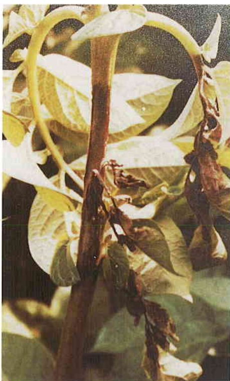
Síntomas producidos por un ataque de P. Infestans sobre planta de patata.

Recoger esporangios mediante un pincel esterilizado en alcohol y enjuagado con agua destilada estéril.