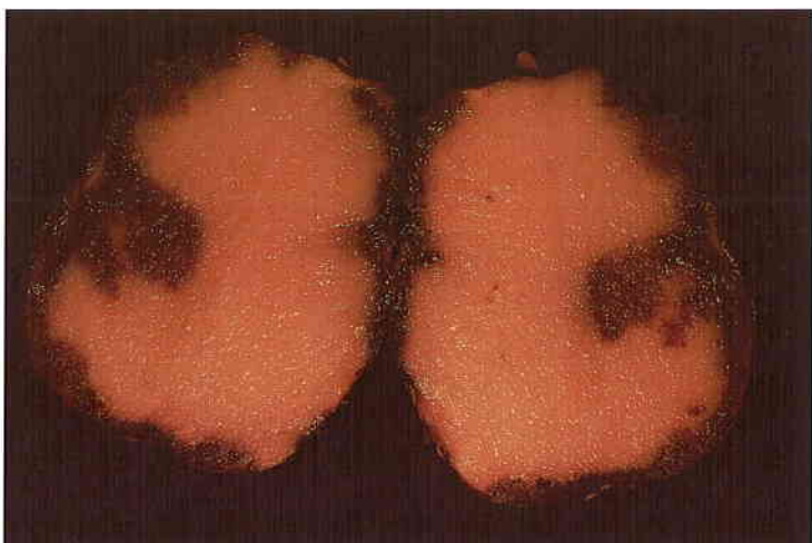
Aspecto interno de lesiones producidas por mildiu sobre tubérculos.