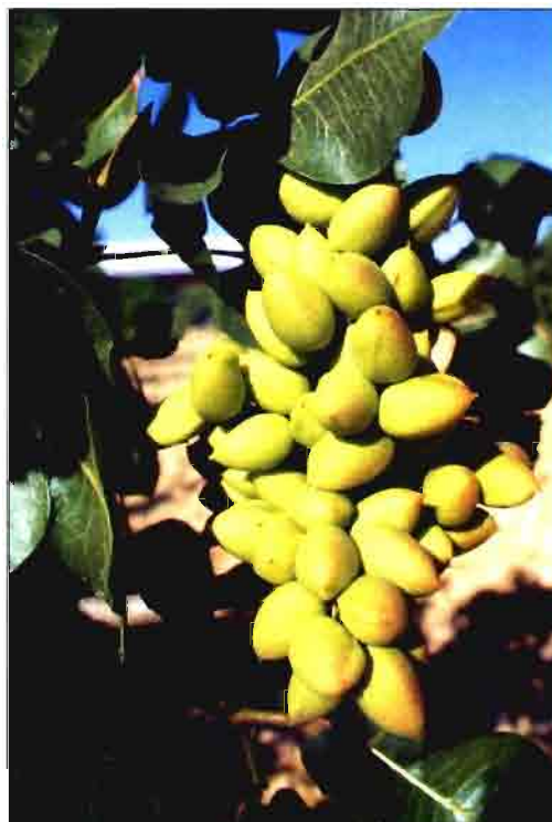
Los ataques de coleópteros se eliminan con insecticidas naturales.

Entutorado. Hasta que el brote de la yema injertada no se haya desarrollado suficientemente no se necesita colocar tutores. Cuando la yema haya emitido un brote con una longitud de dos palmos, el tutor será necesario para proteger dicho brote de los vientos y ser guiado verticalmente hasta que tenga la altura suficiente para ser pinzado (a 150-180 cm en el caso de las hembras y a 250 cm en el caso de los machos). Esta operación se lleva a cabo colocando un tutor o guía al que se ata el brote en dos o tres puntos según su altura. El