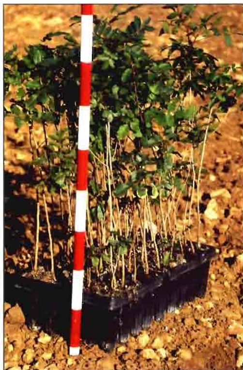
Uno de los patrones usados es el P. terebinthus .

Plantación y cuidados del portainjerto. Normalmente, la época para realizar la plantación del pie o de la planta injertada puede variar desde noviembre hasta mayo, aunque la mayoría de plantaciones se efectúan entre los meses de febrero y abril por razones de temperaturas menos extremas que en diciembre o enero. Conviene, como labor previa a la plantación (dos o tres meses antes), dar un pase cruzado de subsolador (topo) con el propósito de aumentar una mayor disponibilidad de suelo para el sistema radicular. La labor inmediatamente anterior a la plantación es un pase de vertedera a lo