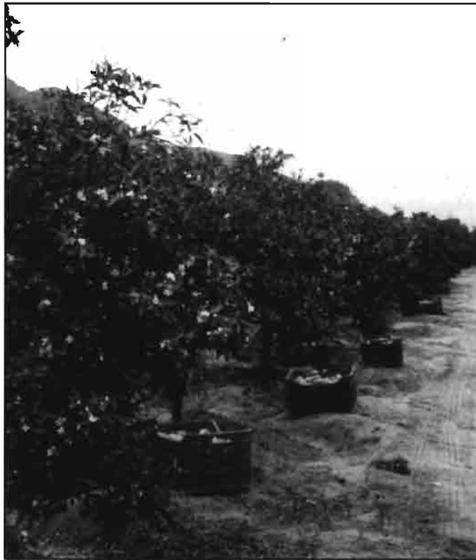
La producción de mandarina de alta calidad para exportación se da en Costa Central. En la actualidad, los volúmenes exportados son limitados.

-Ausencia de cuadros técnicos altamente calificados, en cantidad sufi-