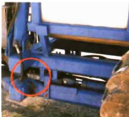
Foto 5. Remolque con células de carga para medir el rendimiento.

Al igual que en otros cultivos, la obtención de un equipo de medida del rendimiento en tiempo real que diera medidas fiables ha sido difícil. Podríamos hablar de dos tipos de vendimiadoras si nos fijamos en el sistema de transporte del fruto hasta la tolva de almacenamiento. El primer tipo de cosechadora evacua el fruto de forma continua, con una cinta de descarga que deja caer la cosecha en un remolque que circula paralelo a la cosechadora. Para este tipo de transporte se instalaron unas células de carga debajo del remolque que acompaña a la cosechadora para medir el peso del fruto cosechado (foto 5). Este primer equipo de adquisición de datos de rendimiento no fue muy preciso debido a que el desplazamiento del remolque junto con la descarga de uva en éste generaba una vibración produciendo una