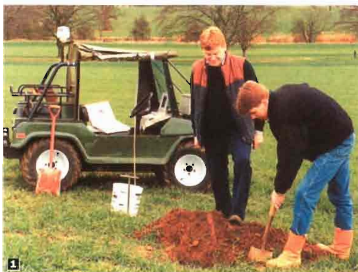
Foto 1. Toma de muestras de suelo en puntos georreferenciados por GPS.