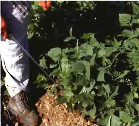
Figura 3. Aplicación de fungicidas mediante pulverización directa sobre el cuello de las plantas.

unidad experimental constaba pues de un total de 210 plantas espaciadas dentro de la línea 0,12 m. Entre cada una de las repeticiones se dejaron como borde dos líneas de siembra.