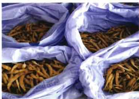
Figura 9. Recuento del número de vainas obtenidas, para cada repetición, en las 30 plantas muestreadas de cada uno de los tratamientos.

septiembre, coincidiendo con el estado fenológico de R9 (maduración) (CIAT, 1987). Se recogieron de forma individualizada 30 plantas al azar dentro de los 4 m centrales de las 3 líneas de siembra interiores de cada unidad experimental, es decir, 90 plantas de cada repetición, y se llevaron al laboratorio donde se realizó un recuento del número de vainas totales (fig. 9), del número de semillas contenidas en diez vainas tomadas al azar en cada uno de estos grupos, y del peso seco de 100 semillas. A partir de estos pará-