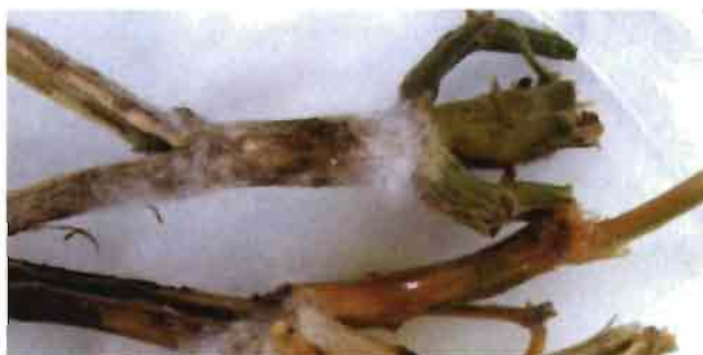
Figuras 4 y 5. Crecimiento de Fusarium solani : en medio de cultivo PDA (fig. 4) y en "cámara húmeda" (fig. 5).

de siembra interiores de cada unidad experimental que estaban contenidas en los 4 m centrales, es decir, 30 plantas de cada repetición. Las plantas fueron recogidas procurando la extracción íntegra del sistema radicular y se llevaron inmediatamente al laboratorio para proceder a su análisis.