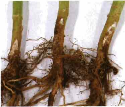
Figura 1. Síntomas de “mal del pie” en plantas de alubia: presencia de micelio en el sistema radicular.

tar, al igual que otros autores han hecho para otras regiones españolas (TELLO et al. , 1985; BERRA y ARTEAGA, 1989 y ASENSIO, 1996), la incidencia del “ complejo parasitario del pie de la judía ”, integrado fundamentalmente por especies de los géneros Fusarium , Rhizoctonia y Pythium , capaces de colonizar las raíces de la planta y entre los que, según DAVET et al. (1980) y SINOBAS et al. (1994), pueden existir fenómenos de antagonismo y sinergismo. En los daños producidos por las micosis pueden influir otros factores, así, según VALENCIANO (2000) el ataque de la mosca de los sembrados ( Delia platura Meigen), plaga endémica de las comarcas alubieras de León, provoca no sólo la pérdida de plantas y el debilitamiento de las recién nacidas, sino también el aumento de la sensibilidad a las enfermedades causadas por hongos de suelo.