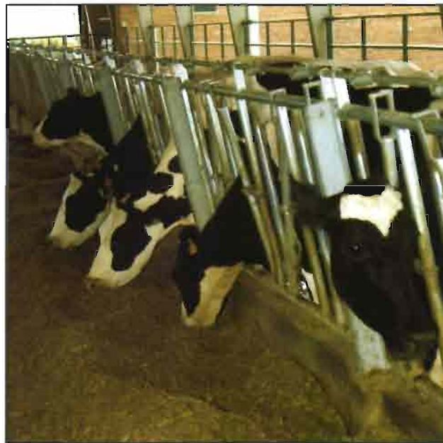
El uso de aditivos puede reducir la formación de metano.

Se ha sugerido que si fuera posible estimular la acetogénesis en el rumen como una ruta alternativa y en competencia con la metanogénesis por la utilización de hidrógeno, sería posible reducir la forma-