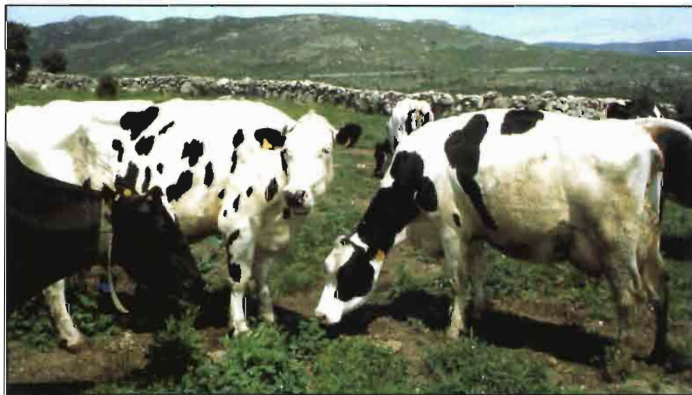
Una vaca produce aproximadamente 250 litros de metano al día.

Aunque el H 2 es uno de los principales productos finales de la fermentación microbiana de los carbohidratos, su concentración en el rumen es muy baja, ya que este gas es inmediatamente utilizado por algunas especies bacterianas que forman parte de la población microbiana del rumen. De esta forma tiene lugar la llamada "transferencia interespecífica de hidrógeno" mediante la asociación entre las especies mi-