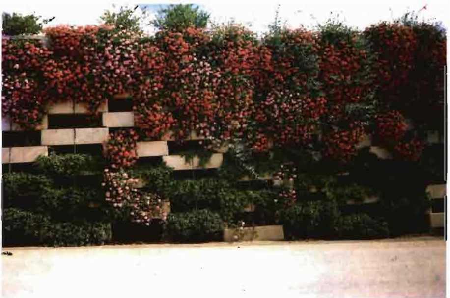
Muro jardinera en el paso inferior norte de la EXPO.

Construcciones modulares objeto de una jardinería perimetral que ha permitido dar una nota de belleza y color a unos edificios que pasarían inadvertidos si no tuvieran jardinería.