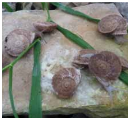
Foto 16: Iberus guatierianus guatierianus reproducidos dentro de las instalaciones de Helixcat.com, scp.