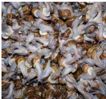
Foto 13: Caracoles Aspersa Aspersa. Autor: Josep Fàbregas Gallart