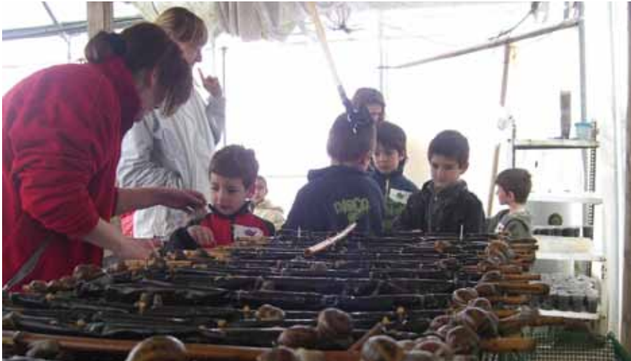
Foto 19: Helicultores haciendo una práctica escolar de observación. Autor: Josep Fàbregas Gallart