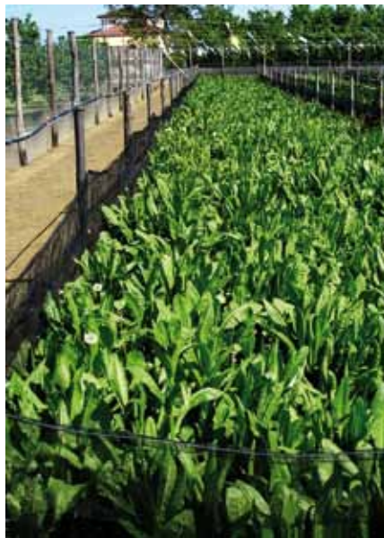
Foto 2: En el sistema italiano se distribuye la vegetación en franjas o huertos estrechos donde los animales hacen la reproducción o bien el engorde en un ciclo de alternancia de cultivos bianual. La alimentación y las zonas de refugio las constituyen las mismas plantas que forman los huertos. Autor: Antonio G. Mayoral