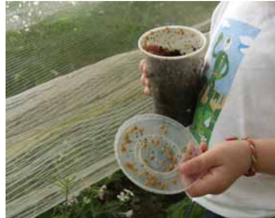
Foto 18: Práctica escolar: colocar crías en una mesa.