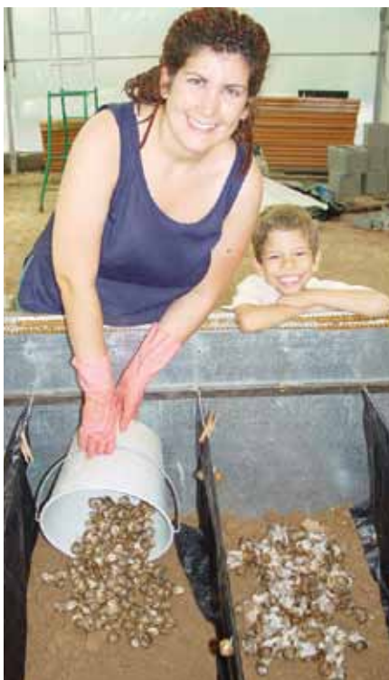
Foto 12: Helicultores guardando caracol para purgar.