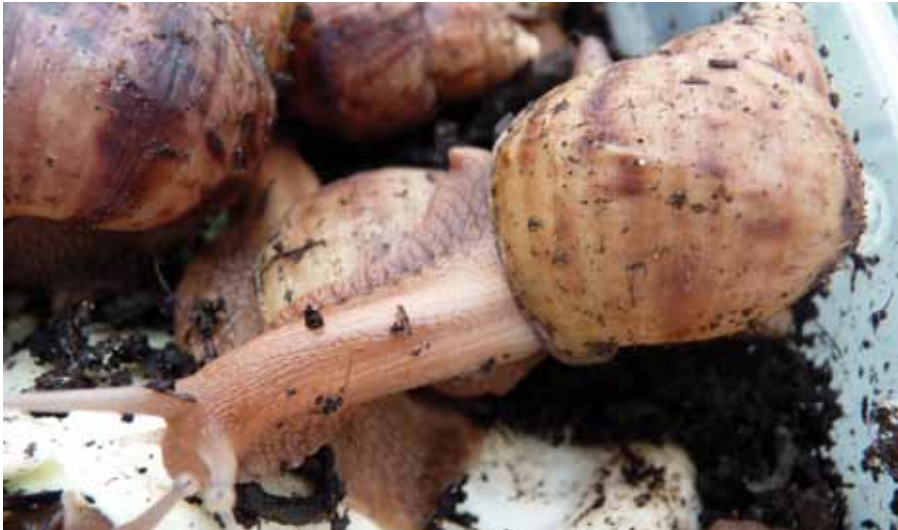
Foto 17: Crías de Achatina Fulica o caracol gigante africano.