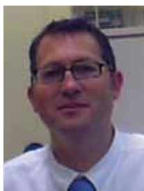
Joaquim Porcar i Coderch Subdirector General de Ganadería

El caracol y todo su entorno es una producción muy nuestra, ligada a la cocina catalana en todo su territorio. Todas las comarcas de Cataluña tienen su cultura del caracol. El caracol está presente en una amplia gama de platos tradicionales catalanes, desde los más ligados a la tierra como comida popular hasta platos de alta gastronomía.