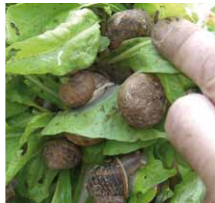
Foto 7: Caracoles descansando.

momento. No ha sido una tarea fácil encontrar gente experta en este campo y que quisiera dar su experiencia, pero por suerte hemos podido ver a los mejores.