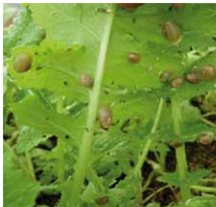
Foto 6: Hoja con caracoles pequeños. Autor: Josep Fàbregas Gallart