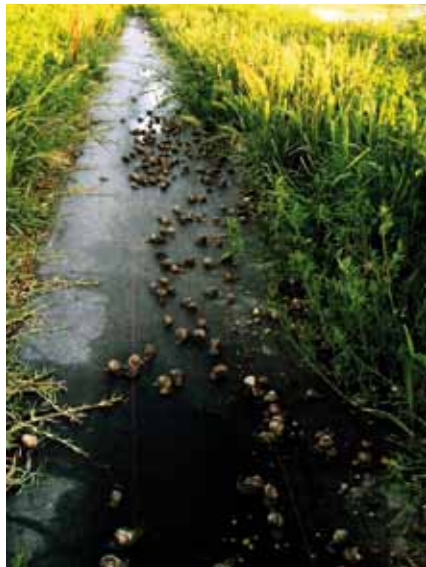
Foto 5: Las explotaciones ecológicas centroeuropeas mantienen poblaciones de caracoles de forma extensiva y seminatural en base a su alimentación de forrajes y subproductos de la agricultura ecológica y utilizando métodos de control físico de las malas hierbas.

Los herbívoros serían aquellos animales que exigen en su dieta una alta proporción de fibra vegetal, resultando imposible alimentarlos sólo con grandes procesados. El uso de forrajes sería para ellos esencial, puesto que cubre necesidades alimentarias específicas, como es el caso de los rumiantes. Los no herbívoros (generalmente