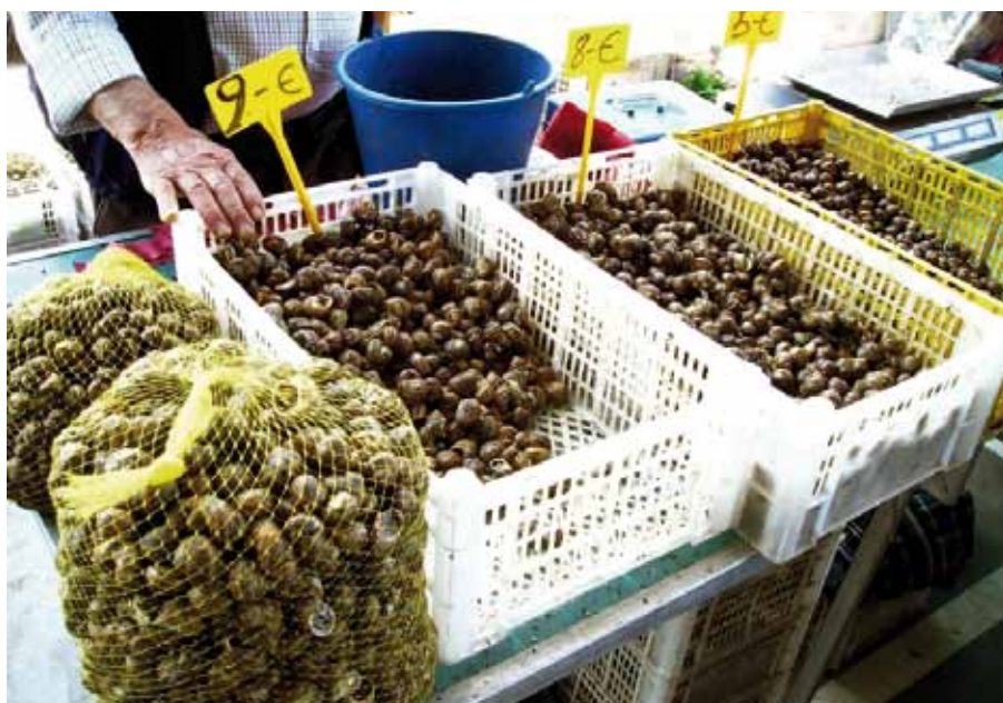
Foto 2: Venta tradicional de caracoles en Lleida.

Las diferentes especies muestran usos culinarios diferentes según medida, consistencia del caparazón y rendimiento en carne, lo que condiciona los tiempos de cocción y su consideración o no como plato único.