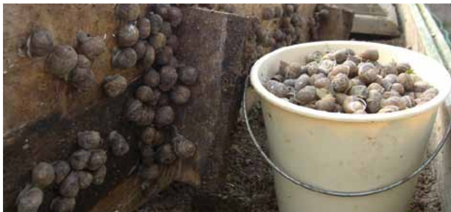
Foto 10: Recogiendo caracoles.