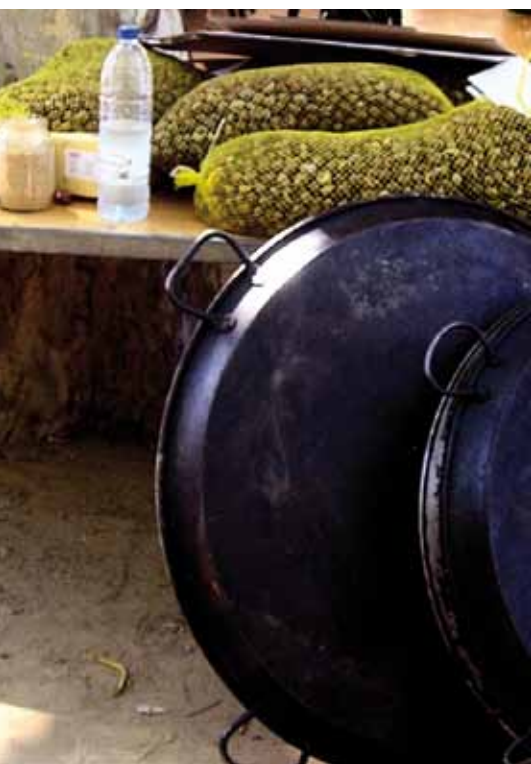
Foto 3: Preparación tradicional de los caracoles: fuego y caracoles.

Las asociaciones de helicultores en Cataluña representan ahora los mayores adelantos en la comercialización y el desarrollo de la helicultura en España, con un empuje y una vitalidad incuestionables.