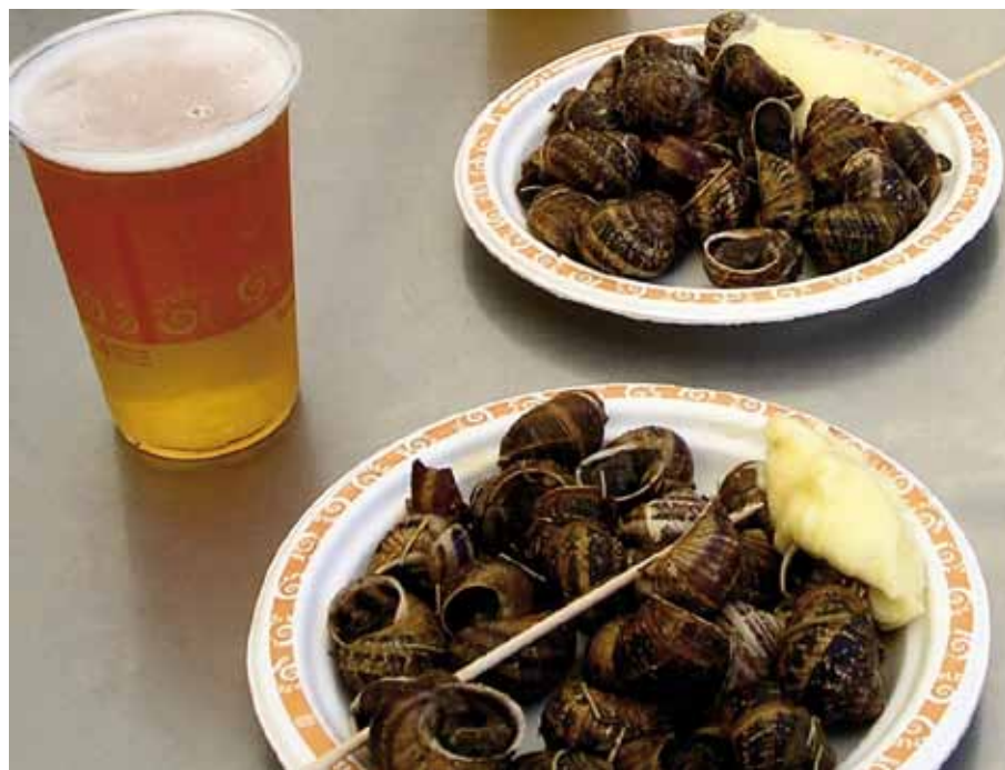
Foto 1: Cerveza y caracoles en la feria de Lleida. Autor: Antonio G. Mayoral