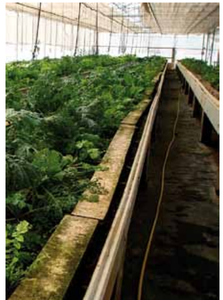
Foto 3: El invernadero intensivo permite actuar cómodamente sobre los animales puesto que los cultivamos sobre mesas elevadas similares a las que se utilizan para la obtención de estacas en floricultura. La alimentación se basa en la utilización de piensos compuestos específicos, que consiguen un crecimiento rápido de los animales y por lo tanto permite repetir varios ciclos anuales de cultivo.