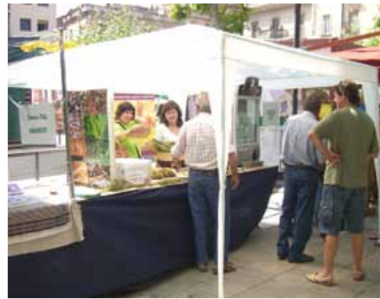
Foto 20: Miembros de la Asociación en una feria.