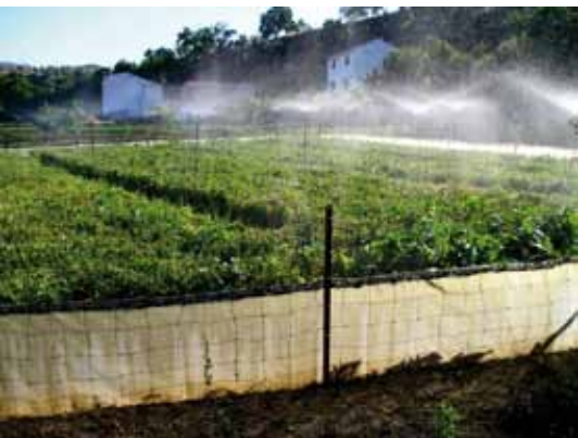
Foto 7: El sistema de engorde rápido es una especialización de los modelos de cría de base forrajera extensivos. Los animales se alimentan de las plantas de cultivo y de piensos específicos de una alta riqueza en calcio, con turnos de cultivo muy cortos, que nunca superan los tres meses.

y contaminantes como los organofosforados y herbicidas, comportándose como organismos centinela (9).