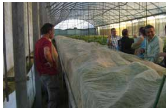
Foto 22: Grupo de gente visitando la explotación de Helixcat.com,scp.

También dentro de nuestras instalaciones hemos podido trabajar otras variedades de caracoles como puede ser el gordo considerado un éxito dentro del mundo de la helicultura, criar el Ibri-rus guatierianus guatierianus en cautividad en invernadero, con una población creciente durante más de 2 años. En la actualidad, estudiamos Achatina Fulica o caracol gigante africano para poder comercializarlo como mascota.