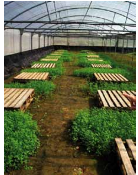
Foto 6: Parque de engorde bajo invernadero, utilizado normalmente en los sistemas mixtos tipo INRA frances.

Por lo tanto, la normativa a desarrollar tendría que tener en cuenta en estos animales la misma