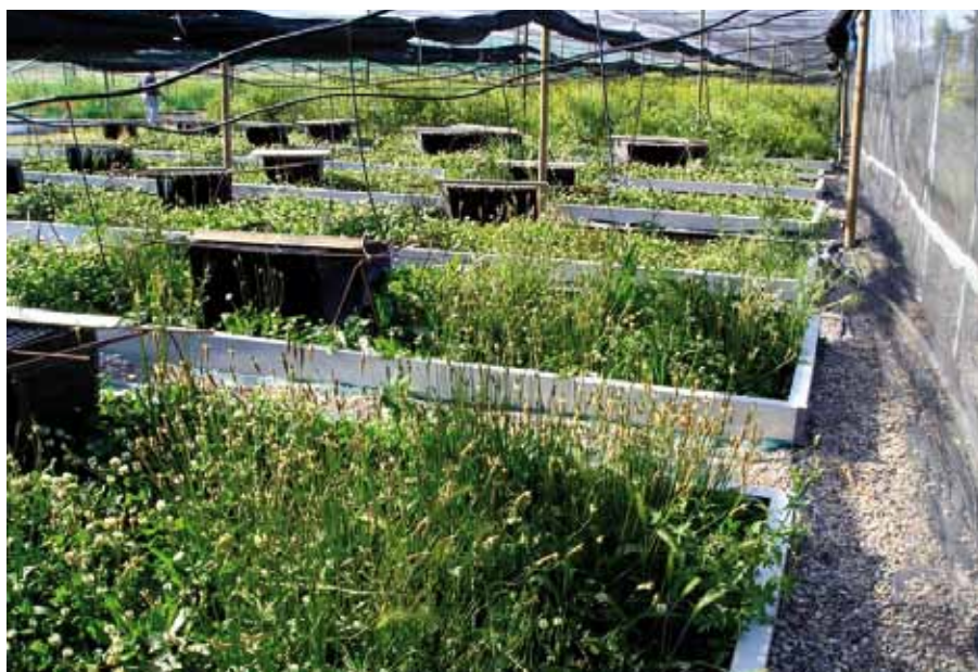
Foto 4: El sistema de parque intensivo distribuye los animales en recintos estrechos plantados donde hay estructuras artificiales verticales que simplifican el proceso de la cosecha. El sistema utiliza exclusivamente piensos en ciclos plurianuales de cultivo.

Más que proponer medidas concretas para la adaptación a ecológico de un determinado modelo de producción, en este trabajo intentaremos aclarar la posición que según nuestro parecer tendría que mantener el caracol y su cría ante la normativa actualmente aplicada a la agricultura y la ganadería ecológicas. Nos proponemos aclarar aspectos que comúnmente quedan olvidados o desatendidos en la aplicación de criterios Eco, sobre todo en los casos en los cuales se propone la transformación de las granjas preexistentes y