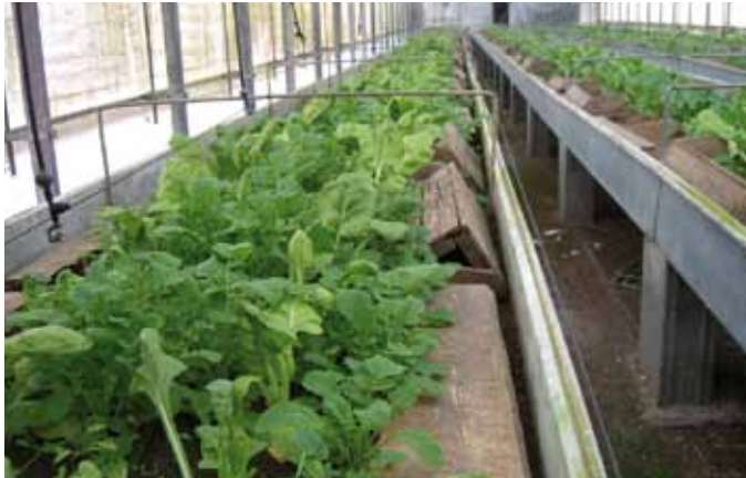
Foto 1: Instalación de Helixcat.com, scp. Autor: Josep Fàbregas Gallart