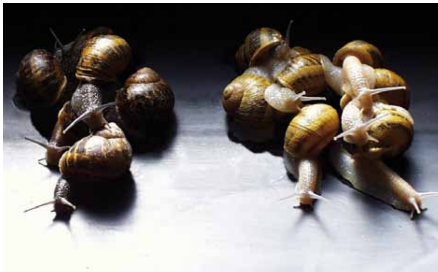
Foto 4: Diferencias entre los caracoles de granja y los caracoles silvestres. Por selección se obtienen animales uniformes, de carne blanca y sabrosa. A la derecha de la foto animales procedentes de la línea racial de la granja experimental del IFAPA. A la izquierda el tipo silvestre.

3 - Fuentes: COMTRADE y Base de datos de Comercio Exterior de España.