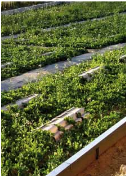
Foto 1: El parque de engorde de estilo francés se caracteriza por el uso de refugios artificiales, de tipo cerámica o de madera, que sirven como comedero para distribuir alimentos de origen vegetal, harinas, etc.