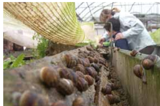
Foto 21: Escolares haciendo una práctica de observación de caracoles. Autor: Josep Fàbregas Gallart