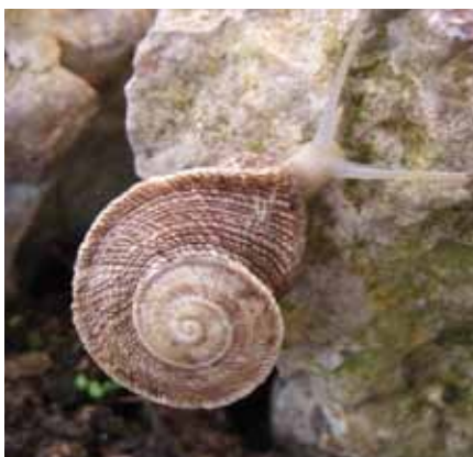
Foto 15: Iberus guatierianus guatierianus . Autor: Josep Fàbregas Gallart