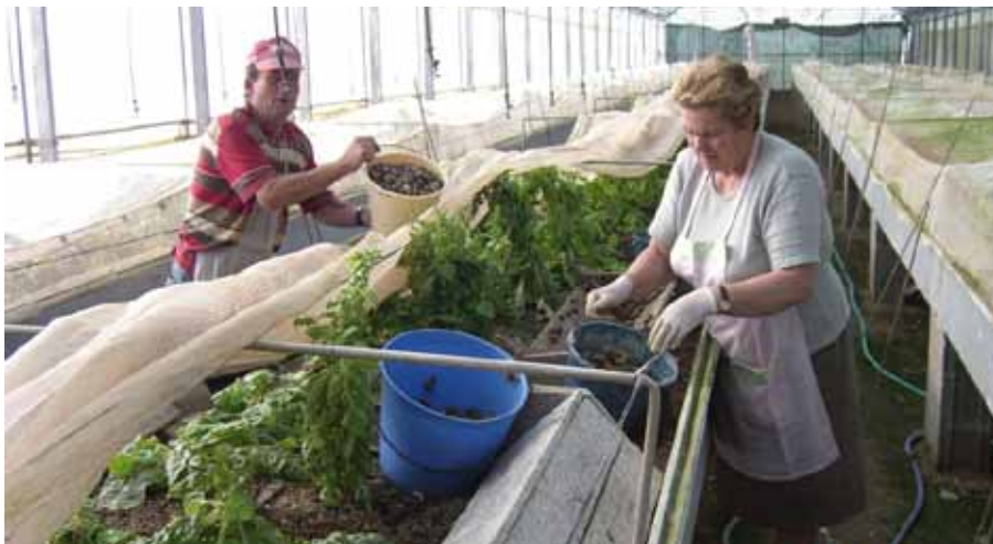
Foto 11: Trabajadores recogiendo caracoles.