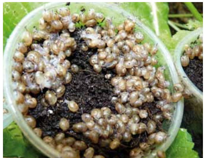
Foto 4: Recipiente con caracoles alevines. Autor: Josep Fàbregas Gallart