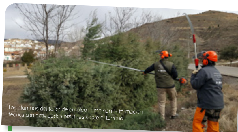
Los alumnos del taller de empleo combinan la formación teórica con actividades prácticas sobre el terreno.

Como es habitual en estos programas de escuelas-taller y talleres de empleo, la formación teórica se combina con actuaciones prácticas sobre el terreno, que pueden proporcionar una mayor visibilidad de los resultados, sobre todo para la población local. Las actuaciones de esta primera edición del taller Montaña de Teruel se localizan en Nogueruelas, Linares de Mora y Alcalá de la Selva, municipios elegidos por ser tres de los que cuentan con una más amplia superficie forestal. Entre las actuaciones que se van a desarrollar, destacamos las de crear un pequeño vivero o zona de sombra para la reproducción de especies vegetales (Nogueruelas), la puesta en práctica de una parcela de ensayo para reproducción micológica (Alcalá), la reforestación de un terraplén y restauración de un antiguo vertedero (Linares) y la elaboración propia por el alumnado de cartelería y señalización en madera de los espacios intervenidos. Por último, se plantean varias sesiones formativas