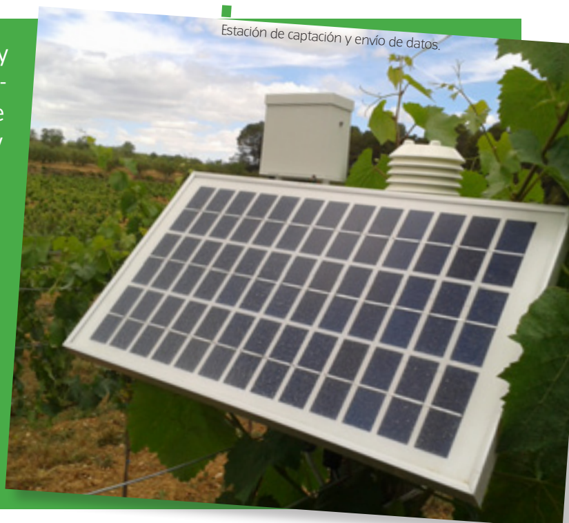
Estación de captación y envío de datos.

Los viticultores conocen muy bien los términos “oídio” y “mildiu”, hongos fitopatógenos que causan enfermedades en la vid y un auténtico quebradero de cabeza por los daños que pueden producir. En efecto, una cepa infectada pierde parcialmente el follaje y la producción de uva, por eso demandan soluciones y si son ecológicas mejor. Un proyecto pionero desarrollado en Cataluña ofrece ya resultados positivos, gracias al uso de tecnologías avanzadas.