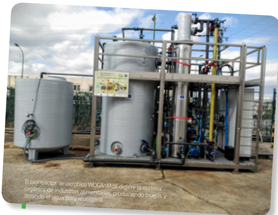
El biorreactor anaeróbico WOGAnMBR digiere la materia orgánica de industrias alimentarias, produciendo biogás y filtrando el agua para reutilizarla.