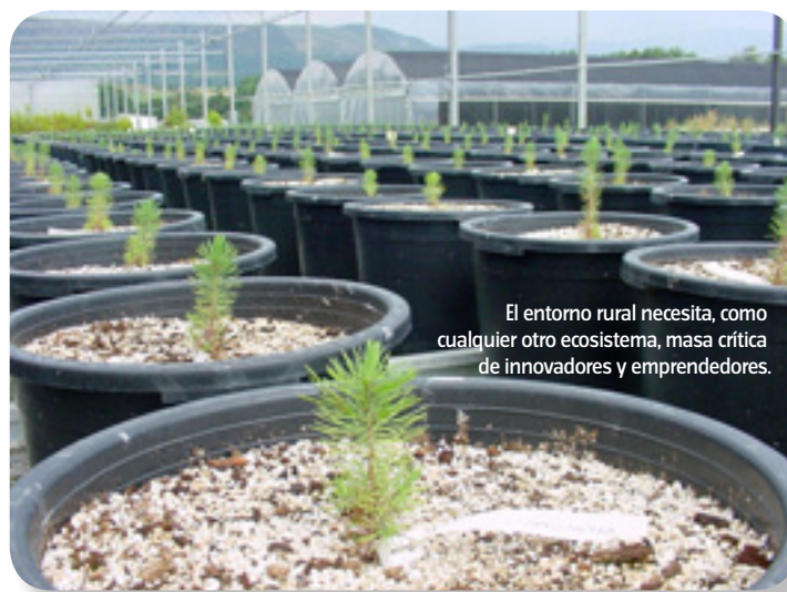
El entorno rural necesita, como cualquier otro ecosistema, masa crítica de innovadores y emprendedores.

La lateralidad, la inspiración cruzada se expresa en miradas nuevas, en gente capaz de ver soluciones diferentes y ser luego suficientemente tenaces como para llevar estas nuevas ideas a la práctica. Tener ideas no es innovar. Las ideas nuevas solamente abren la puerta a la innovación, pero el camino por recorrer es largo. Es un camino de exploración donde, igual que cuando andamos por el monte, a menudo debemos dar rodeos, ir adelante y atrás, buscar a derecha e izquierda cuál es la opción que nos llevará a una solución.