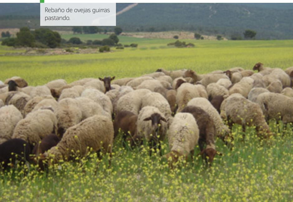
Rebaño de ovejas guirras pastando.

“Quizás mi conocimiento de las ayudas europeas me hizo comprender desde el principio que la oportunidad comercial estaba en la diferenciación del producto: a mayor calidad, el precio es mejor”, cuenta. Pronto se dio cuenta de que la tarea era ardua, así que buscó el apoyo de la Conselleria de Agricultura, que “entendió el valor de preservar el