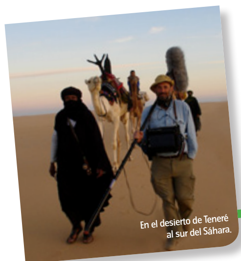
En el desierto de Teneré al sur del Sáhara.

C. d H: La huella sonora se ciñe a zonas biogeográficas más que a países. En España y en todo el mundo hay un empobrecimiento radical del mundo sonoro. Literalmente, vamos a marchas forzadas hacia la primavera silenciosa. Llevo más de 30 años grabando con mucha atención y las aves silvestres han caído a la mitad en toda Europa. Si hace cinco años había cinco codornices hoy quedan