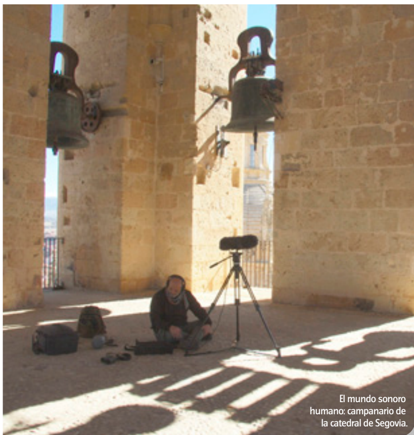
El mundo sonoro humano: campanario de la catedral de Segovia.

dos. Si había siete tórtolas, hoy quedan tres. Salvo las aves forestales, que han subido un poco, el resto han caído. Las alondras están a la mitad, igual que el sisón, por algo SEO/BirdLife lo ha declarado Ave del Año 2017. Esta situación repercute inmediatamente en el paisaje sonoro. Actualmente los sonidos son más monótonos y monocordes porque hay menos intérpretes. Esto sí que es la huella sonora de un país... En Inglaterra se escuchan cuatro cucos por los diez que hace pocos años había en una arboleda.