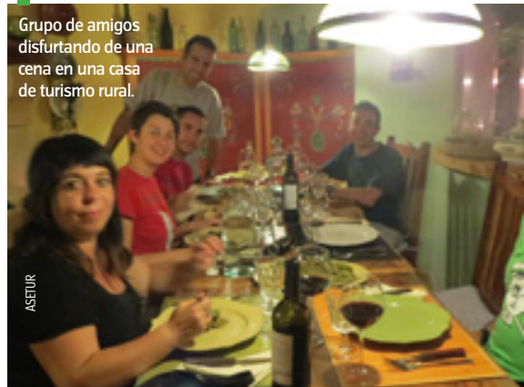
Grupo de amigos disfrutando de una cena en una casa de turismo rural.

Este importante y sostenido crecimiento del sector llevó a la creación de Asetur , una asociación joven, que se ha ido desarrollando a la par que el propio sector y que intenta evolucionar de acuerdo con los logros, las necesidades y los problemas de sus asociados. Por ello, en estos años se ha convertido en el referente del turismo rural ante las instancias públicas, tanto la Administración central como las administraciones autonómicas. Para cumplir adecuadamente su papel,