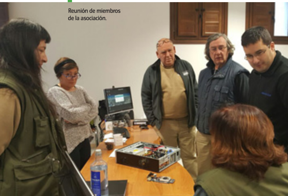
Reunión de miembros de la asociación.

Los temas que se abordan durante los nueve meses de la formación son los de maquinaria forestal, incendios forestales, tratamientos silvícolas y trabajos forestales, que son los puntos fuertes de la temática del taller. Como formación complementaria se estudian también la micología y los aprovechamientos madereros, ambos en auge en la comarca, por lo que ha suscitado mucho interés entre el alumnado.