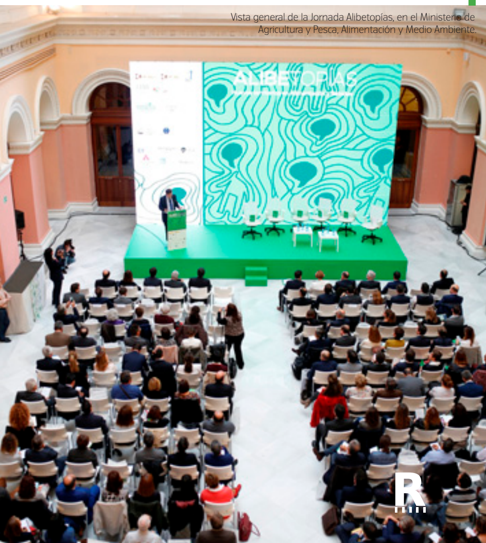
Vista general de la Jornada Alibetopías, en el Ministerio de Agricultura y Pesca, Alimentación y Medio Ambiente.

Antes de que llegaran los encuentros de Alibetopías, FIAB ya había dado algunos pasos para impulsar proyectos de I+D+i y ayudar a su divulgación y réplica dentro del sector. En su página web dispone de una base de datos con más de 600 iniciativas (véase recuadro de página 14) vinculadas a una amplia diversidad de productos y procesos.