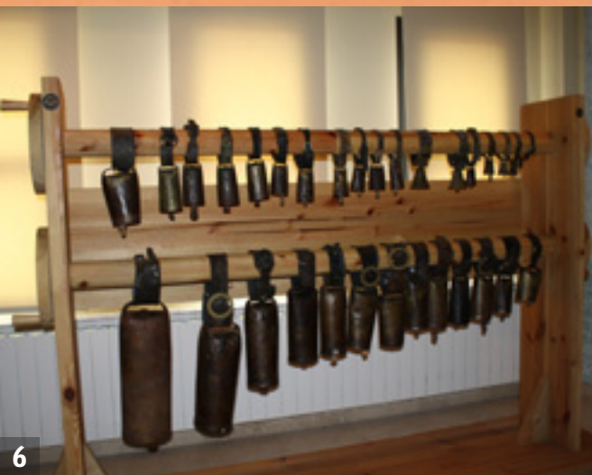
MUSEO DE LA TRASHUMANCIA