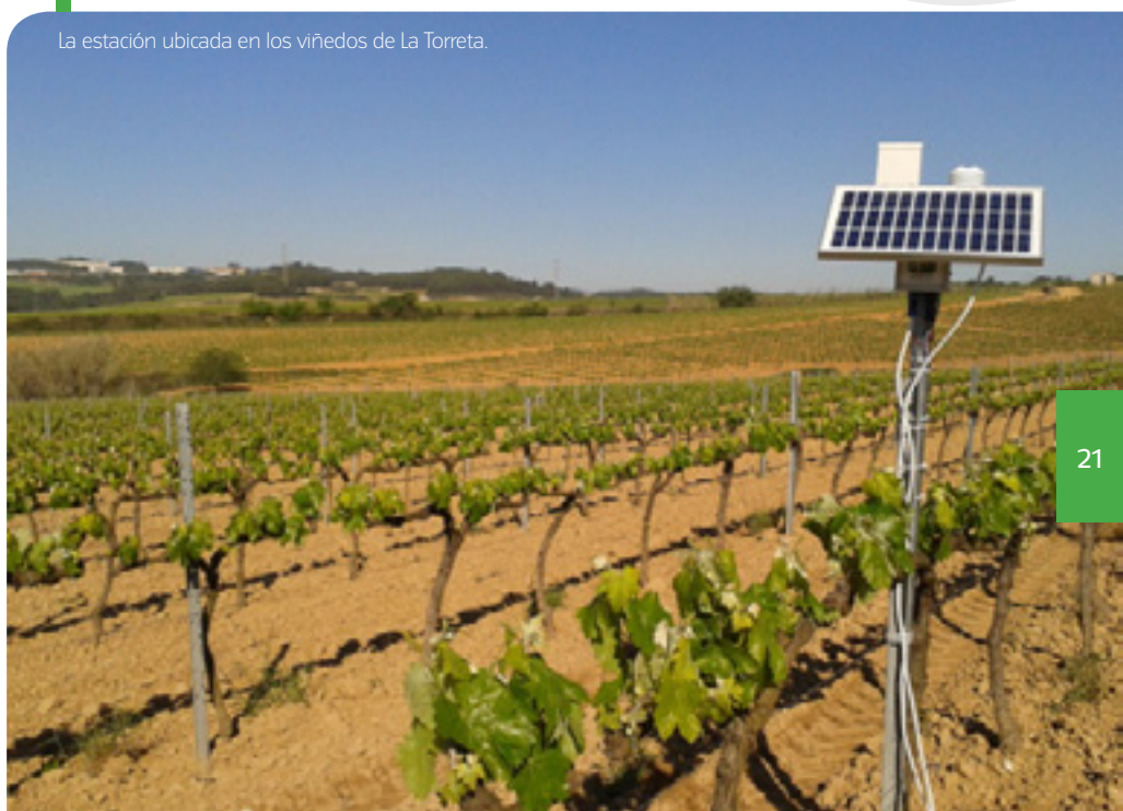
La estación ubicada en los viñedos de La Torreta.

Reducir los tratamientos al mínimo imprescindible sin aumentar por ello la exposición a las plagas solo se puede