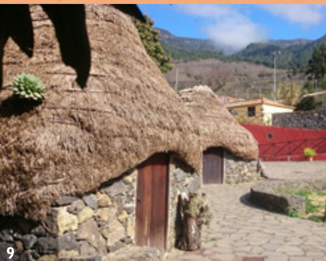
MUSEO Y PARQUE ETNOGRÁFICO PINOLERE