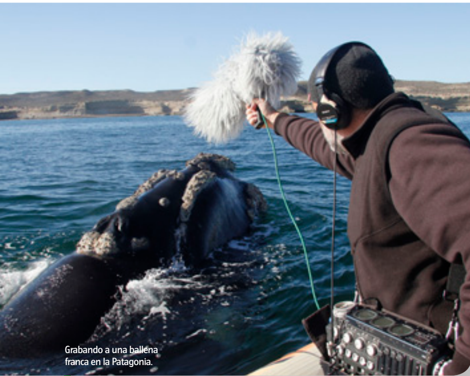
Grabando a una ballena franca en la Patagonia.

qué momento del día, por lo que un animal canta o reclama y por cómo suena lo que dice. El mismo ruiseñor tiene una voz muy distinta por el día que por la noche, aunque diga las mismas frases, igual que tu voz suena distinta en la calle o en una iglesia. Cuando has grabado mucho y cumplido tus primeros objetivos, lo que buscas son esos matices. Por ejemplo, me divierte grabar el efecto del eco de un búho real más que al búho mismo. Son los colores del sonido, que no siempre son fáciles de definir, pero que matizan y caracterizan.