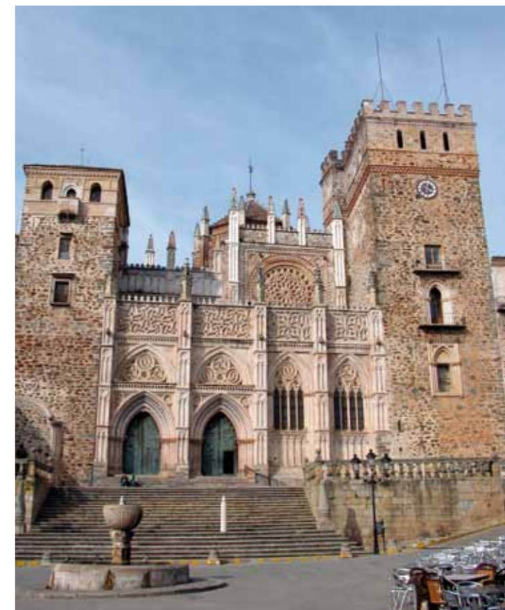
El monasterio de Guadalupe, en Cáceres, es el punto neurálgico del proyecto Itinere 1337 .

Afortunadamente, algunas de estas sendas ya están en parte recuperadas, como es el caso de las vías verdes de Vegas Altas del Gadiana y de La Jara, más de 150 kilómetros rehabilitados en su día dentro del programa de reconstrucción de antiguas líneas de ferrocarril abandonadas. Por este motivo, el proyecto cuenta no solo con la participación de los GAL, sino también con la de otros colectivos que con su conocimiento e infraestructuras contribuirán a mejorar la plasmación del proyecto. "La respuesta que hemos tenido ha sido satisfactoria en todos los sentidos, la gente está implicada con el proyecto y tenemos el apoyo de