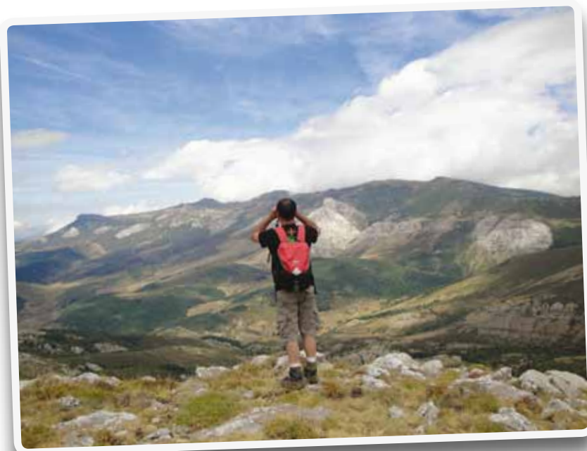
La observación de rapaces es una de las actividades principales del turismo de naturaleza.

De momento, la etapa de diagnóstico ha confirmado lo ya comentado más arriba, que el elevado número de espacios y la singularidad y diversidad de los recursos (antes que la mayor o menor superficie calificada) determinan una de las bases para la viabilidad del proyecto; y que los datos resultantes, individuales y generales, “revelan el valor patrimonial de los territorios participantes y aseguran una base sólida,