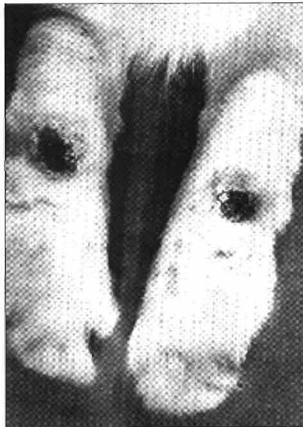
Pododermatitis ulcerativa bilateral en la superficie metatarsiana plantar en su fase inicial.

La enfermedad evoluciona generalmente de forma crónica, y dado el posicionamiento de la lesión su