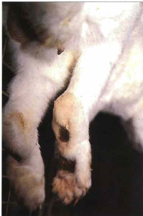
Las afecciones podales en su fase séptica se pueden extender a toda la planta con lesiones irreversibles.

Cuando la afección se infecta aparecen supuraciones y abscesos.