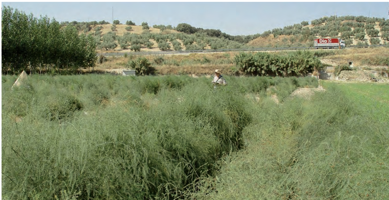
Foto 5. Ensayo experimental de descendencias híbridas en Huétor-Tájar (Granada)

saparecer y con ella se perdería un valioso recurso genético. Debido a ello Grupo PAI de Mejora Genética Vegetal de Córdoba llevó a cabo en el Otoño de 2005 diferentes expediciones para recoger semillas de parcelas plantadas con 'Morado de Huétor' y ha establecido dos parcelas experimentales para su conservación ex situ, una en la finca de 'Rabanales' de la Universidad de Córdoba y la otra en la finca 'Alameda del Obispo' del IFAPA en Córdoba.