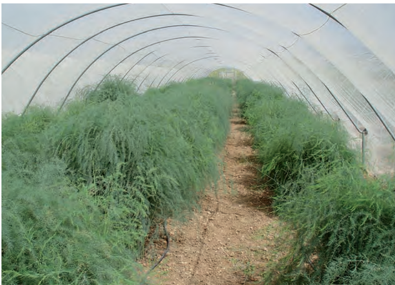
Foto 1. Colección de plantas seleccionadas en las parcelas de los agricultores

España, Andalucía es la Comunidad Autónoma con la mayor producción de esta hortaliza, siendo la Vega de Granada la principal zona productora (26.900 t.) (MAPA 2007) representando aproximadamente un 50% de la producción nacional. En el conjunto de la Unión Europea la Vega de Granada está considerada como la principal región productora de espárrago verde. Históricamente la superficie nacional de este cultivo fue creciendo desde los años 60 hasta principios de la década de los 90, pero a partir de ahí su superficie cultivada ha ido disminuyendo ( Gráfico 1 ) (MAPA 2007). Este descenso, puede ser debido al abandono del cultivo del espárrago blanco, el cual requiere un mayor coste, lo que ha hecho que algunos productores o empresarios agrícolas hayan promovido su cultivo en otros países donde la mano de obra es más barata y el coste de producción menor. En cuanto al espárrago, para su consumo en verde, la superficie cultivada ha ido aumentando significativamente desde finales de la década de los 70 hasta principios del S. XXI.