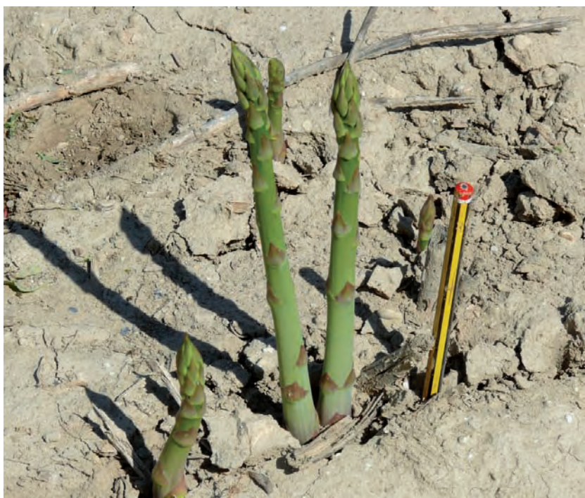
Foto 4. Aspectos de los espárragos de un híbrido triploide experimental

espárrago. Ejemplos de variedades triploides se pueden encontrar en otras especies cultivadas como sandía, uva, mandarina, remolacha, plátano, etc. que se caracterizan por ser estériles y no producir semillas. Esta línea de trabajo surge a raíz de la observación al comienzo de nuestro programa, en parcelas cultivadas con la variedad local, de hembras prácticamente estériles y con ciertas características como tallos de mayor cali-