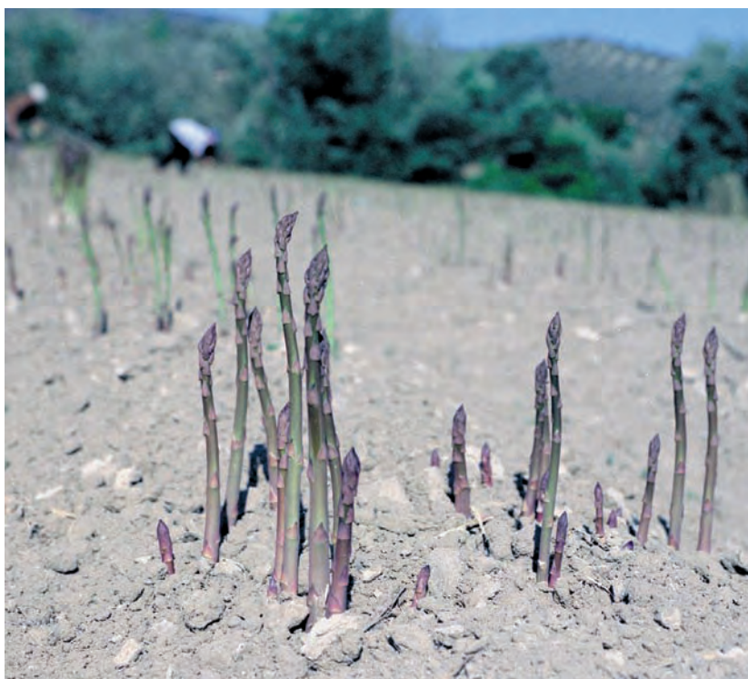
Foto 2. Plantación de espárragos con la variedad local 'Morado de Huétor'

Actualmente se considera que existe una fuerte erosión genética (pérdida de variabilidad genética) en la especie debido a que casi todos los cultivares de espárrago utilizados hoy día proceden de una población holandesa del siglo XVIII, la población 'Violet Dutch'. Esta población se extendió por toda Europa debido a sus características y fue dando lugar a diferentes variedades poblacionales. Sobre ellas se ha llevado a cabo una larga labor de mejora desde principios del siglo pasado, que ha incrementado la homogeneidad de las variedades actuales. En los primeros pasos de su mejora se lograron notables incrementos de la producción, pues fueron eliminadas las plantas poco o nada productivas que representaban un alto porcentaje en la población de