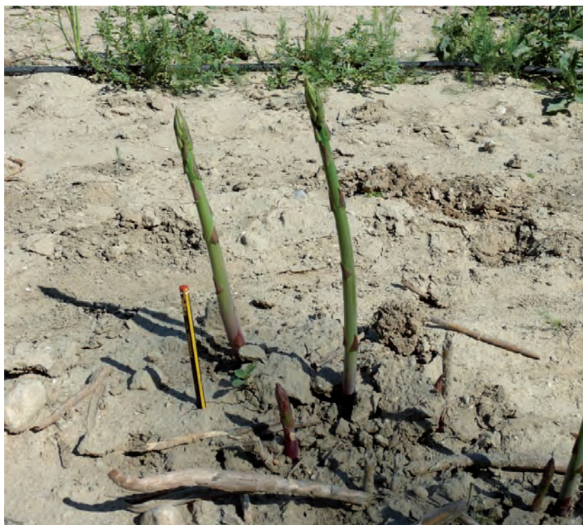
Foto 3. Aspectos de los espárragos de un híbrido octoploide experimental

La adaptación local es muy importante en los programas de mejora de cultivares de espárrago