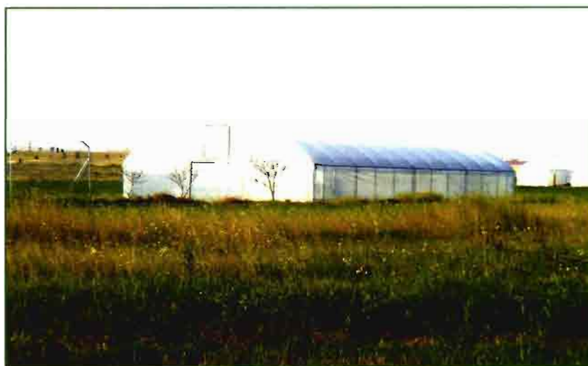
Tabla 4. Respuesta de la altura de planta, diámetro y número de hojas por planta a distintos materiales plásticos de cubierta

La producción precoz (total y destríos) no fue alterada con significación estadística por los tratamientos aplicados, lo que sugiere que los plásticos tricapas no alteraron la producción precoz frente a los monocapas, tanto en los tratados como en los tratados con filtros anti-UV (Tabla 2). El tratamiento M3 redujo la presencia de frutos gruesos (G+) res-