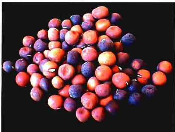
Vicia narbonensis . (semilla)