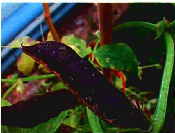
Vaina ya madura de la Vicia narbonensis .

La existencia de un elevado déficit de proteína vegetal para la formulación de piensos en la Unión Europea es un hecho más que probado. Igualmente, uno de los factores limitantes en nuestro país de la ganadería ecológica es la necesidad de piensos que cumplan el requisito de lo reglamentado como "ecológico", estando totalmente prohibida, entre otras cosas, la inclusión de ningún componente de naturaleza transgénica en la formulación del pienso.