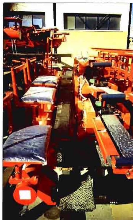
Máquina trasplantadora de seis surcos

Podemos afirmar que la incorporación al sustrato de materia orgánica en las cantidades que lo hace un 20% de compost de subproductos de café mejora, en conjunto, la germinación y la calidad final de las plantas de remolacha producidas con la técnica del paper-pot . La adición de este material en porcentajes mayores no mejora las anteriores características y dificulta enormemente la manipulación del sustrato y su compactación en el banco de semillado.