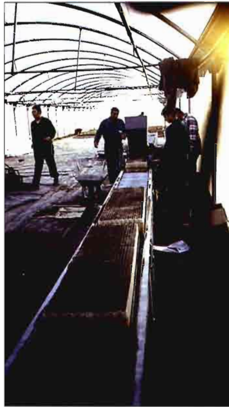
Tapado de la semilla con el sustrato de cultivo

4. Trasplante. Las bandejas de cultivo deben regarse con suficiente agua el día anterior de su salida del invernadero para que puedan separarse unos cartuchos de otros sin dificultad. Posteriormente, y mediante una trasplantadora diseñada para este fin, se realiza la colocación de la planta en el terreno definitivo. Después del trasplante se debe realizar un riego de asiento para favorecer el arraigo de las plantas.