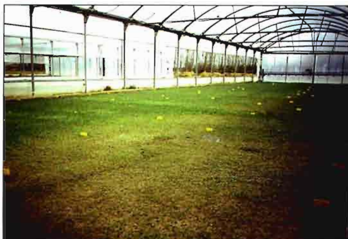
Ensayo de sustratos