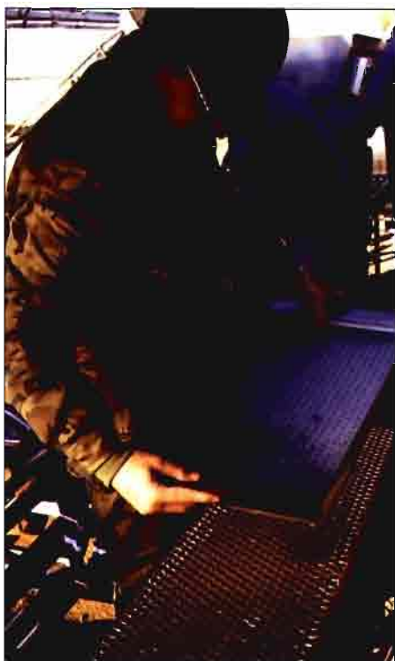
Labor de siembra en los cartuchos de paper-pot

adquisición en la zona, al encontrarse una fábrica de café en la provincia. Este compost, rico en humus, también permite mejorar el pH del sustrato debido a su reacción ligeramente ácida.