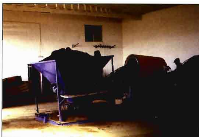
Tolva para preparación del sustrato y llenado de las bandejas.