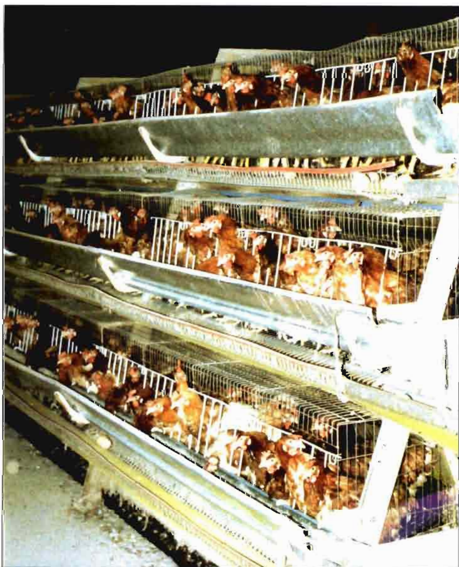
Producción de huevos de consumo en baterías de puesta

La dureza del agua es una medida que hace referencia principalmente a las cantidades de sales de calcio y magnesio disueltas en el agua. La dureza no es en sí una variable perjudicial para la salud de las aves. Sin embargo, si es importante su control ya que la precipitación de estas sales puede dañar el sistema de purificación y distribución del agua, siendo la principal causa de obstrucción de los bebederos. Por lo tanto, la dureza puede llegar a convertirse en un verdadero problema para la explotación si llega a obstaculizar la distribución del agua de bebida.