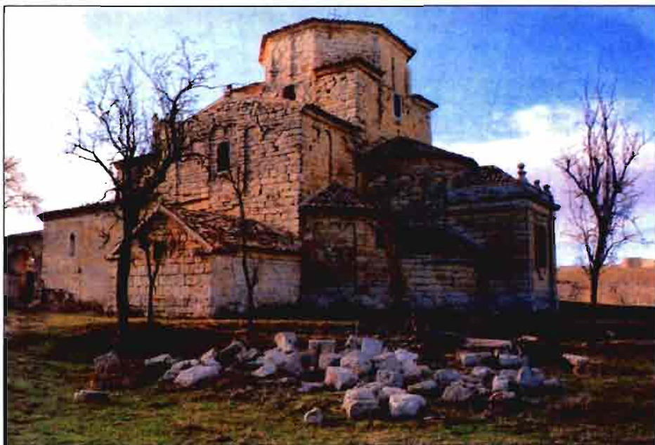
Ermita de Sta. Marta. Ureña (Soria).

En este contexto hay que interpretar el hecho de que se hable, con más insistencia de lo habitual, de poner en marcha