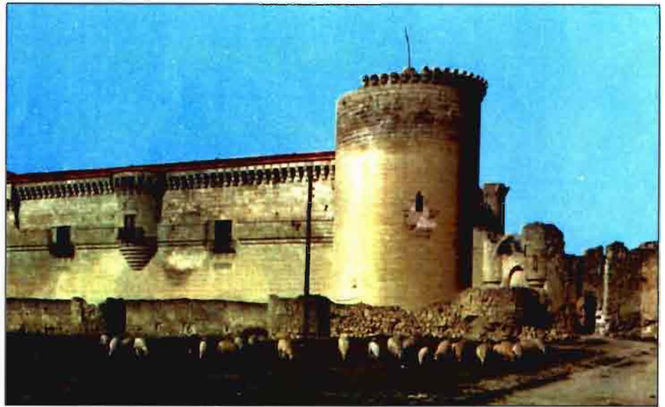
Castillo de Cuéllar. (Segovia)

Los grupos seleccionados en el Marco de la Iniciativa LEADER y del Programa Operativo de Desarrollo Rural deberán esforzarse en la promoción de cuantas iniciativas surjan en su Comarca, buscando la financiación necesaria en las líneas de ayuda existentes en cada momento y utilizando los recursos que se pongan a su disposición para apoyar los proyectos que no tengan otro medio de financiación.