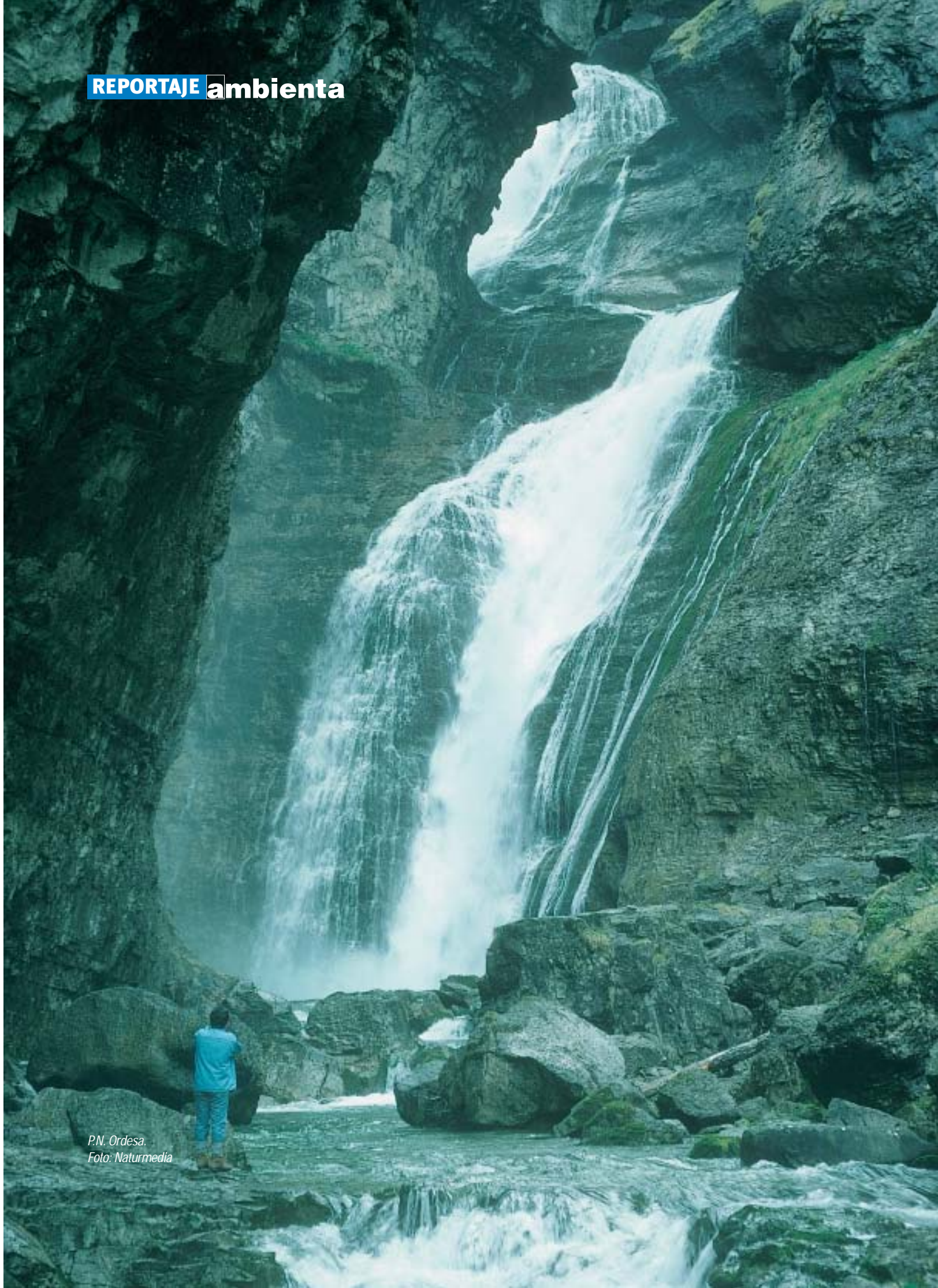
P.N. Ordesa.