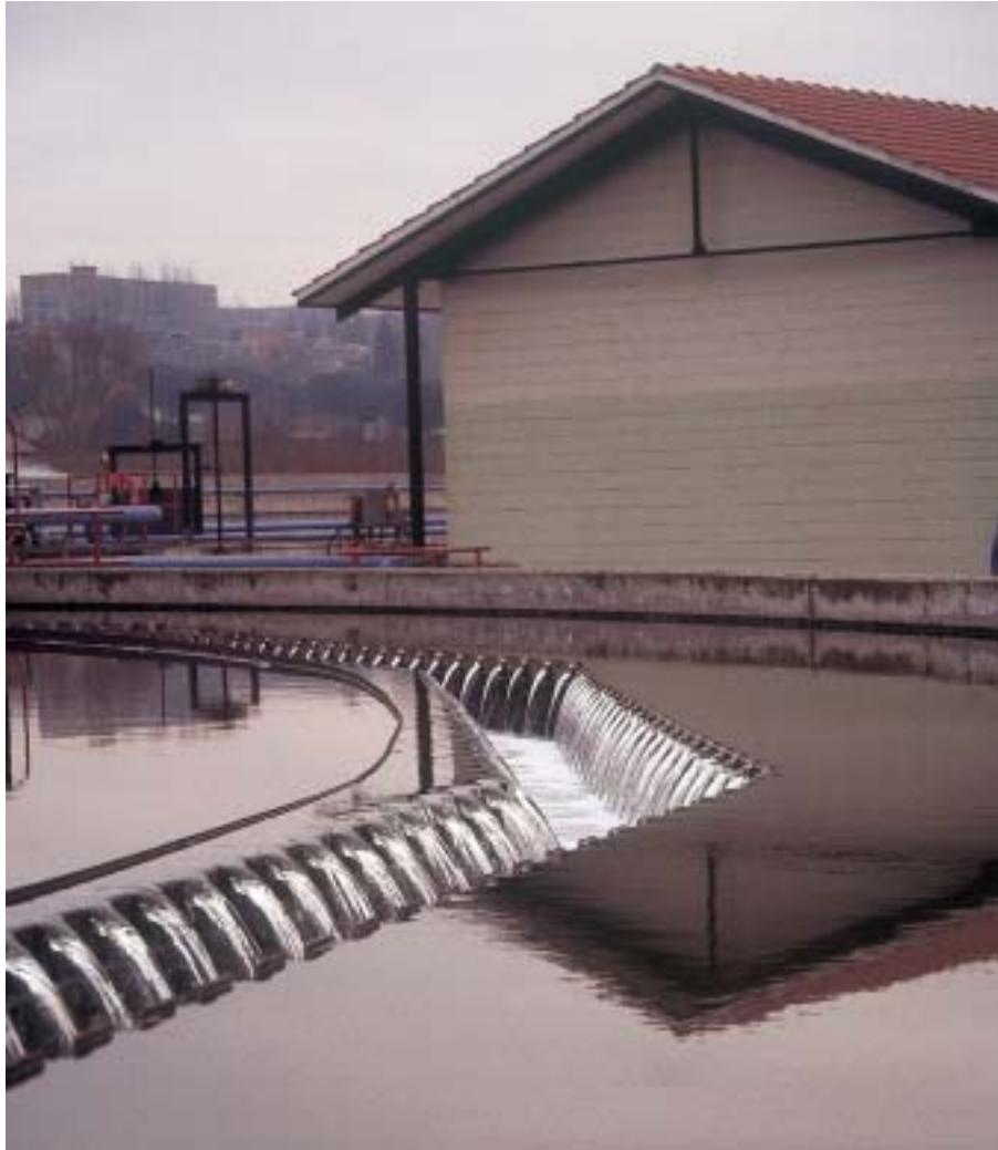
La calidad del agua sólo es alcanzable mediante una política de continuada de obras hidráulicas, de regulación y saneamiento. Depuradora de aguas residuales.