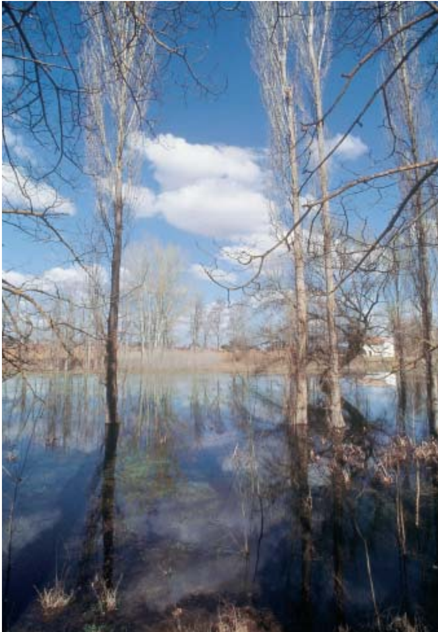
El agua es un recurso natural y productivo imprescindible para la vida del hombre.

Los órganos de las confederaciones tienen por su composición una naturaleza participativa y democrática, acorde con las recomendaciones de la declaración internacional sobre gestión del agua. En este sentido, la participación de los usuarios es un signo característico de nuestra administra-