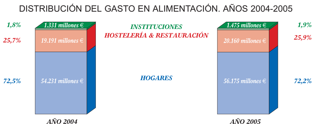
Gráfico n.º 4: