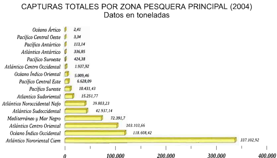
Gráfico n.º 1:

Con base en la información recogida en la base de datos, en el gráfico adjunto se refleja el total de capturas realizado por la flota española en cada zona de pesca principal durante 2004.