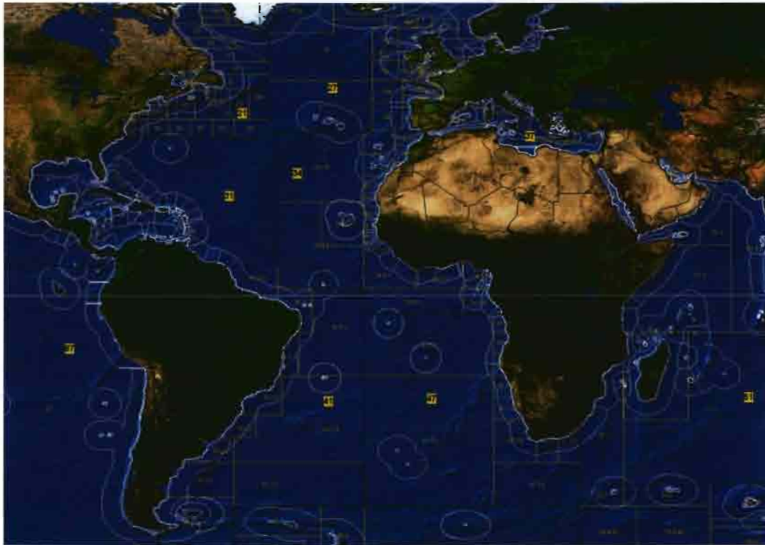
Mapa n.º 2: