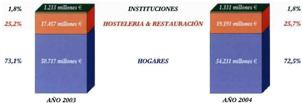
GRÁFICO DISTRIBUCIÓN DEL GASTO EN ALIMENTACIÓN. AÑOS 2003-2004