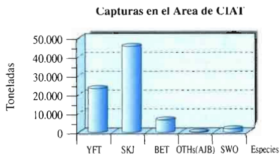
Cuadro n.º 14: