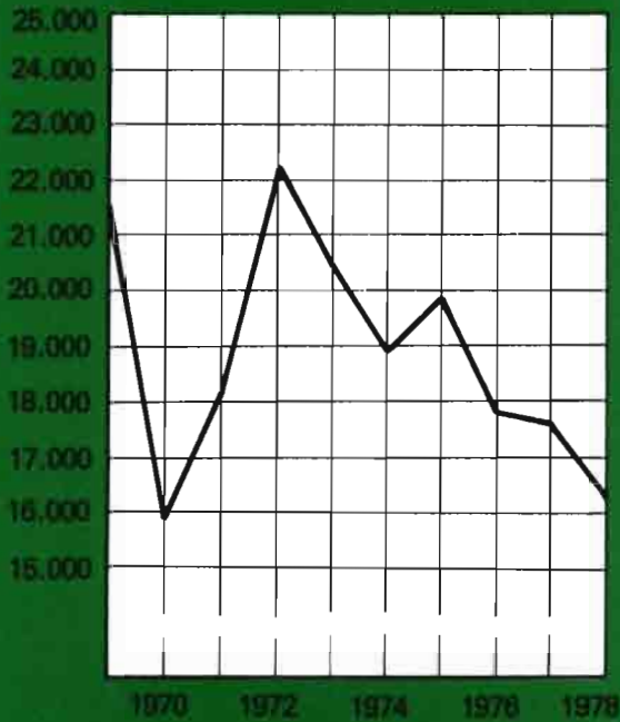
PRODUCCION DE NARANJA EN MILES DE D.M.