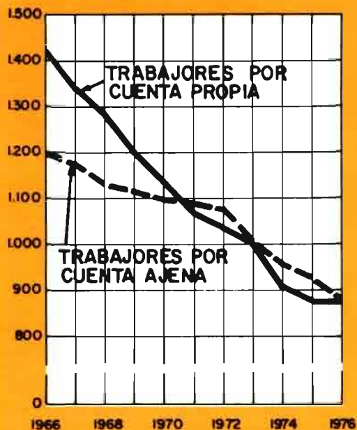
MUTUALIDAD NACIONAL AGRARIA TRABAJADORES AFILIADOS Miles de afiliados

En 1976 la población afiliada ha disminuido en un 2,7 por 100 respecto al año anterior, destacando como se indicaba anteriormente la persistente disminución (4,7) de los trabajadores por cuenta ajena y la casi estabilidad en la cifra de trabajadores por cuenta propia (-0,7 por 100).