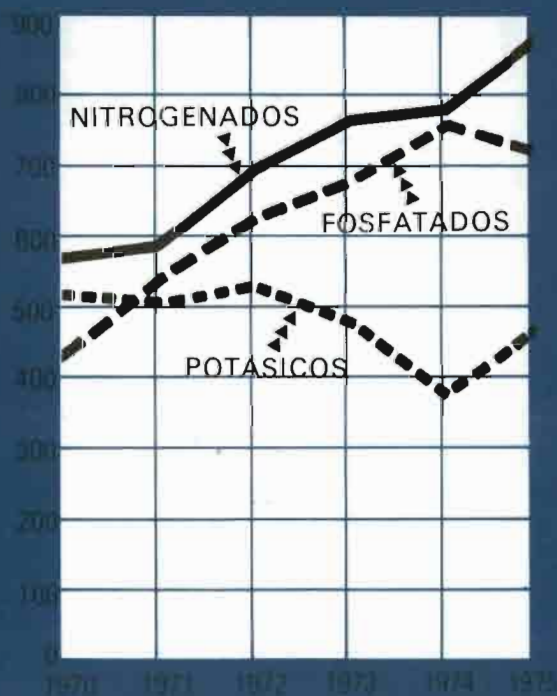
PRODUCCION DE ABONOS (EN MILES DE TM. DE ELEMENTOS FERTILIZ.)

Dentro de la estabilidad en conjunto antes apuntada, aparece un importante incremento en el consumo agrícola de la urea, del nitrosulfato amónico y pequeños aumentos en sulfato amónico y soluciones líquidas. Disminuye el consumo de nitrato amónico cálcico y de complejos.