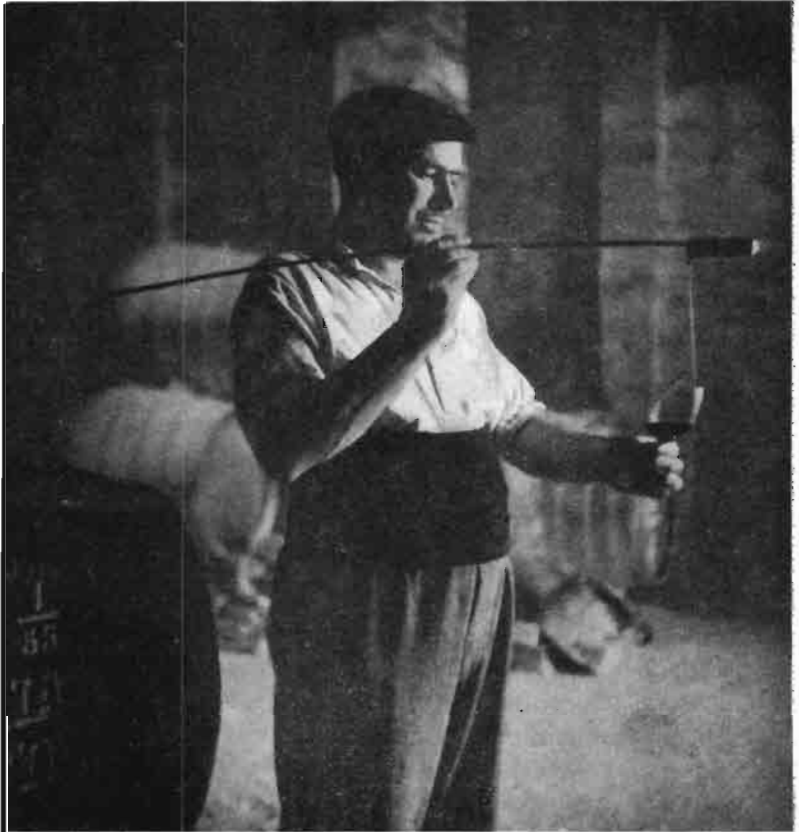
Fig. 2.—La clásica venencia, que se utiliza en las bodegas jerezanas para tomar muestras de vinos, es de plata con vástago de ballena.

Las aludidas heces no se disuelven con facilidad en su