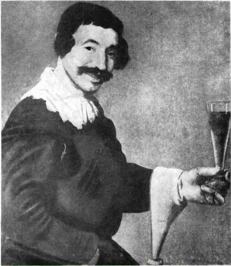
Fig. 1.—Un cuadro de Velázquez, poco conocido, que representa un bebedor. Se conserva en el Museo de Toledo-Ohío (Estados Unidos).

quesos fuertes, como el Roquefort, es difícil poder juzgar, con independencia, un vino delicado y fino. Con frecuencia, incluso a los buenos bebedores, les precisa enjuagarse bien la