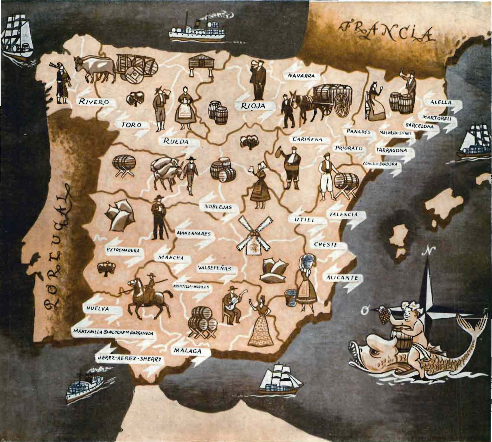
El vino español en el mapa.