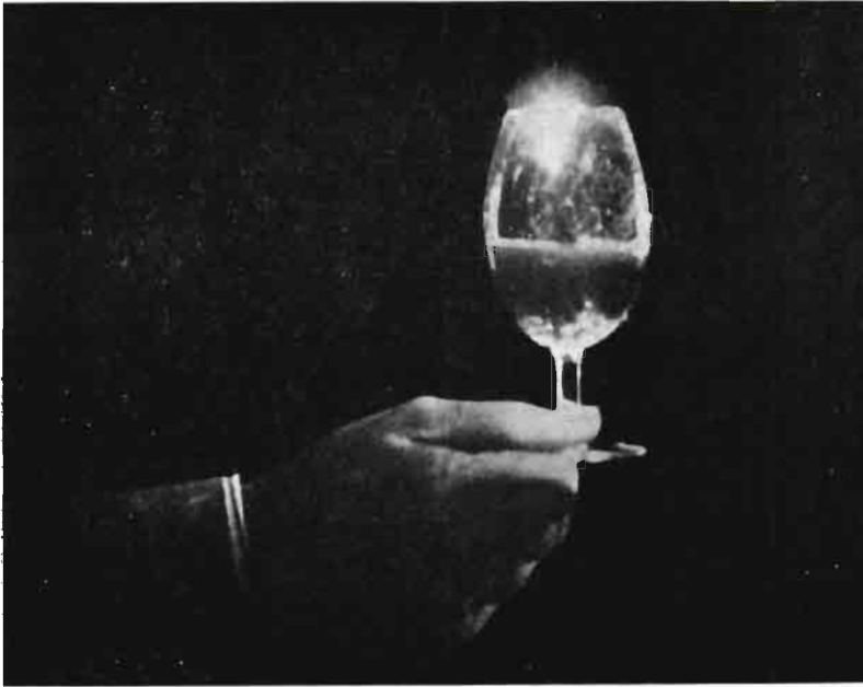
Fig. 3.—Los buenos bebedores prefieren siempre copas de cristal incoloro en las que pueda apreciarse el color, la limpidez y el brillo del vino.

antes de tiempo, o por la acción del frío, o por la del calor. El frío, haciendo insolubles muchas cosas del vino que no debió embotellarse por falta de crianza en el tonel o por so-