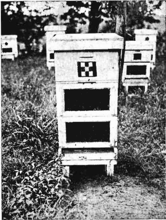
Colmena iluminada, con dos cámaras de cría, vista de frente, en que se aprecia la abertura para la ventilación.

Las experiencias se efectuaron con colmenas Dadant y de tipo americano análogo a nuestra "Perfección", colocando en la parte anterior de la cámara de cría un doble cristal bien ajustado, para evitar el paso del aire. La separación entre los cristales, que constituye el espesor de la cámara de aire, es de 5 a 8 milímetros. Las colmenas se orientaron al Este, a fin de que sólo recibieran el sol por la mañana, ya que el tejadillo