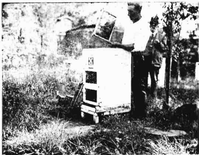
Inspeccionando una colmena iluminada.

Que la orientación más adecuada es ésta: Este y Sur.