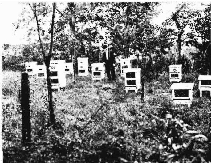
Colmenar constituido con colmenas iluminadas en las proximidades de Botauzos.

Vamos a empezar por exponer brevemente las observaciones