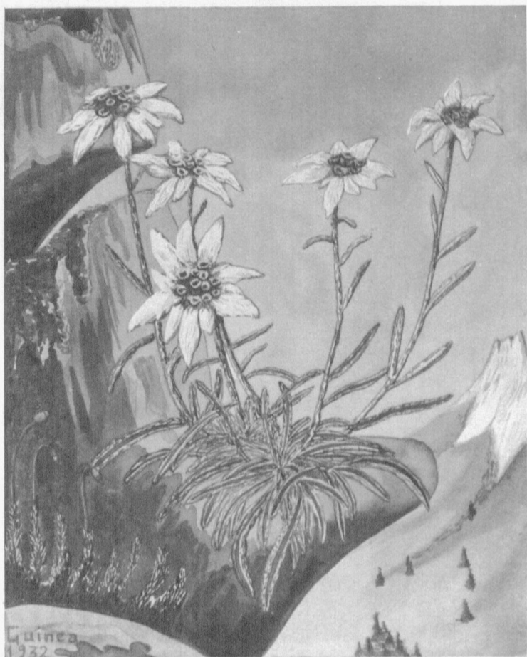
«Edelweiss» o pie de León.