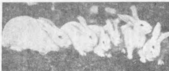
Coneja y gazapos de la variedad blanca del Gigante de España.

nera indubitable la fijeza del color, aunque existen muchos y bellísimos ejemplares; pero calcúlese la revolución que se operará en la