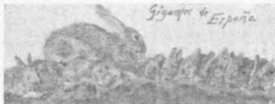
Gigantes de España.

Orejas grandes, anchas, carnosas, termina-