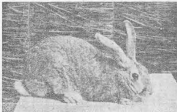
Conejo Gigante de Normandía.

El Gigante de Normandía no es tan grande y voluminoso como el de Flandes, pero es