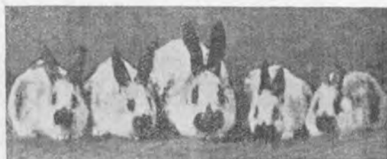
Mariposa: madre y cuatro gazapos.

En las mejillas, a veces, posee otras manchas, y en caso de existir, no deben depender