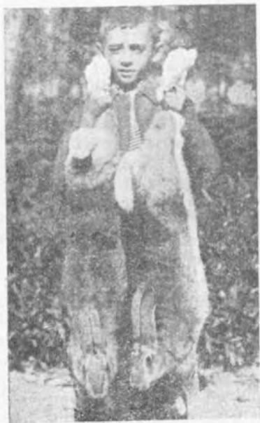
Dos hermosos gazapos Gigantes de España, leonados.

erian muy bien; por ser una raza muy fuerte, bien constituida, las madres tienen abun-