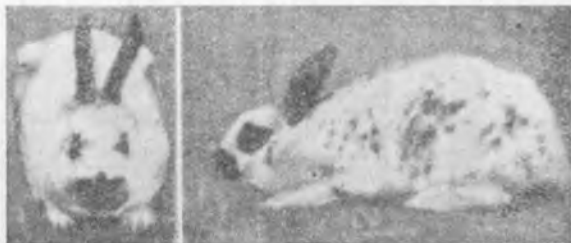
Conejos Mariposa: macho y hembra.

es un buen animal de producto para la carnicería, y que, en realidad, sería preciso la separación completa y radical de esta raza en dos variedades. Una para carne, en la que se tuviera en cuenta, de manera muy importante, sólo la talla y el peso, y otra deportiva,