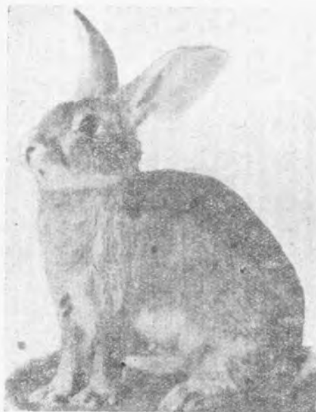
Conejo Gigante de España.]

Esta raza, que es de nueva creación, ha adquirido rápidamente una gran preponderan-