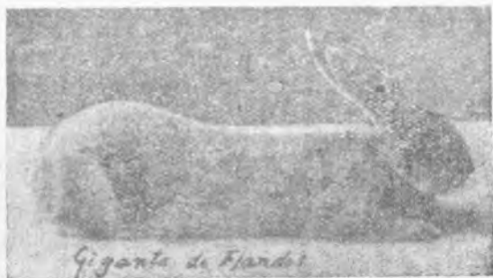
Gigante de Flandes.

Los belgas describen al Flandes como ani-