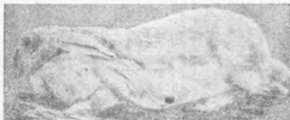
Gigante de Flandes.

Hemos dicho anteriormente que el conejo Gigante de Flandes no es a propósito para una explotación industrial, y vamos a razo-