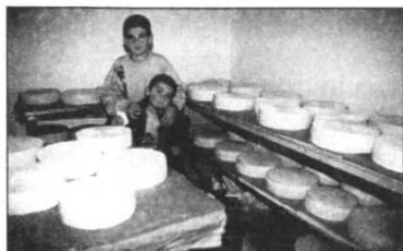
Sala de maduración del queso