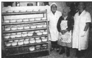
Tres generaciones de mujeres queseras