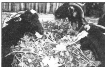
Alimentación de cabras estabuladas con aprovechamiento de monte