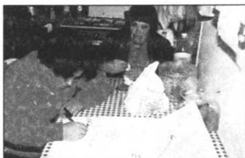
Diagrama de Tortilla realizado por Guacimara