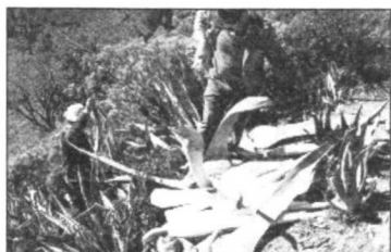
Arranque, procesado, transporte y picado de una pita para suministrar al caprino