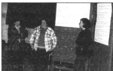
Mujeres exponiendo los resultados de un taller