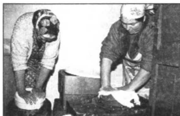
Prensado manual del queso