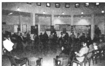
Asistentes al último taller