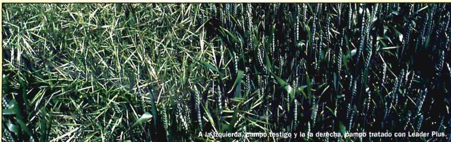
A la izquierda, campo festigo y a la derecha, campo tratado con Leader Plus.