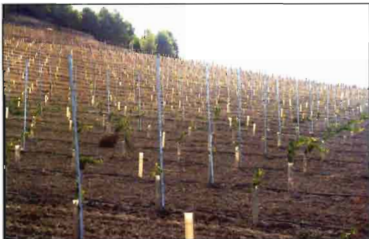
Cada año se realizan nuevas plantaciones en la misma ladera.

Para la realización de las labores cuentan con tres tractores viñeros, binador, intercepas, maquinaria para recoger la poda, pequeños remolques de acero inoxidable en los que realizan la vendimia, pulverizadores y atomizadores para la aplicación de tratamientos todos ellos propiedad de la empresa. Son los propios empleados esta sociedad los que las llevan a cabo todas las tareas.