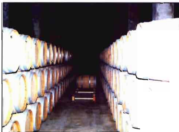
Barricas en la nave de crianza.