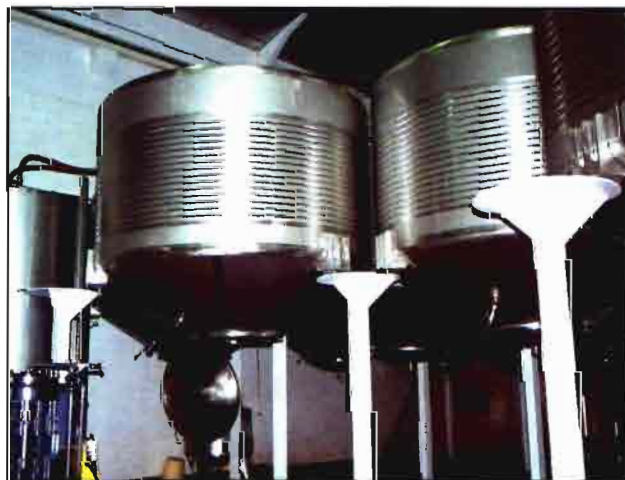
Depósitos dentro de la bodega.

Ya este año se ha producido una ampliación de la bodega, puesto que poco a poco se queda pequeña. Los socios contemplan un bonito proyecto futuro a medio plazo de ampliación de bodega al triple de lo que en la actualidad es, lo que significa ampliar la capacidad hasta 1.200.000 botellas, que llegue a acoger la producción de toda la futura plantación. Un ambicioso proyecto que triplicaría la capacidad de las actuales instalaciones de crianza, de elaboración y almacenaje que los socios esperan contemplar a medio-largo plazo. ■