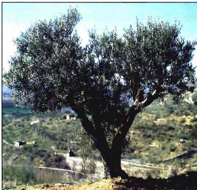
El sector debe plantearse nuevas estrategias de calidad.

El sistema de clasificación debería ser simplificado y resultar más comprensible, transparente y fiable ante los consumidores. Asimismo, debería clarificar al consumidor las diferencias entre los distintos tipos de aceite de oliva, de forma jerárquica, de manera que se valoricen los tipos de aceite de oliva de mejor calidad, y que se evite inducir al error al consumidor.