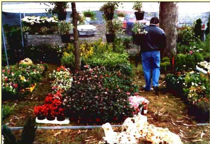
El sector de flores y plantas tiene una cada vez más dura competencia exterior.

El sector productor exportador de flores y plantas constituye un sector significativo de la economía agraria y comercial española dado su porcentaje de participación en la producción final agraria, su contribución a la balanza comercial agraria, su alta capacidad de generación de empleo y su posición competitiva en el mercado comunitario, situación que se ha logrado con un nulo nivel de ayudas y a pesar de una fuerte competencia externa.