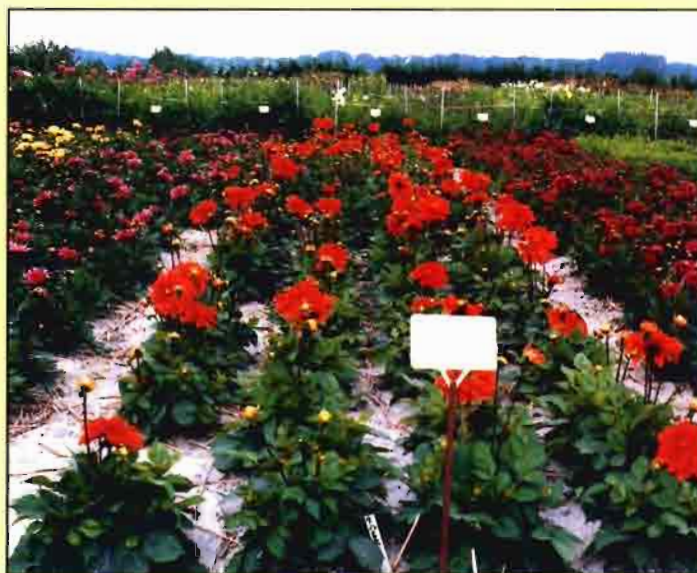
La reforma de la OCM debe mantener las ayudas a la promoción del consumo.

En este sentido, el comercio de flor cortada entre los países ter-