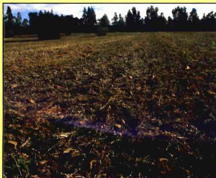
Aporte de enmienda orgánica sobre parcela.