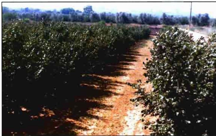
Plantación joven de avellanos.

pitalización, mezclados, seguramente, con cuestiones políticas más o menos locales, desembocaron en una situación de práctica suspensión de pagos. Las cuentas de la Sección de Crédito de todos los socios quedaron bloqueadas, y todos los socios quería decir, prácticamente, todo el pueblo. Recuerdo ahora, como anécdota curiosa, en mi condición de socio de la Cooperativa, las reuniones multitudinarias en el cine del pueblo hasta altas horas de la madrugada, en alguna ocasión hasta el amanecer. Ahora me parece recordarlo como las últimas películas del neorealismo italiano, pero en aquel momento la situación era realmente grave... Afortunadamente una mayoría de socios acordó, ahora hemos visto que con buen criterio, "reflotar" la Cooperativa y así podemos enorgullecernos de la buena situación actual.