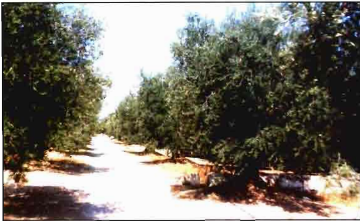
Tipica disposición de los olivos en el Camp de Tarragona: a lo largo de los caminos y alrededor de las parcelas.