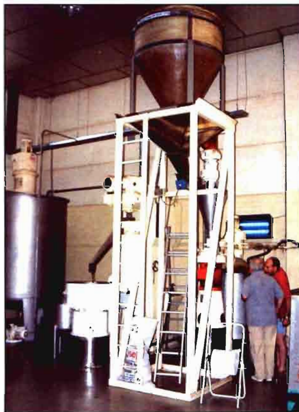
El Director Gerente de la Cooperativa explicando a uno de los socios el proceso de transformación de la avellana.

La última apuesta, que cuando aparezcan estas líneas quizás ya será la penúltima, es la creación de un vivero en el que se reproduce la variedad de avellana "negreta", libre de virus, para suministrar a los socios que van substituyendo y racionalizando las viejas plantaciones.