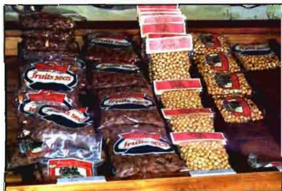
En las dos imágenes se pueden ver detalles de la Agrobotiga.