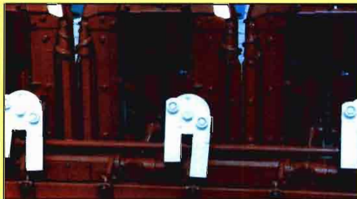
Fig. 1. Cabezal con dispositivo de picado de las cañas.

El uso de gradas de discos sólo es posible si se emplean con poco ángulo de apertura y realizando una labor superficial. Los ape-