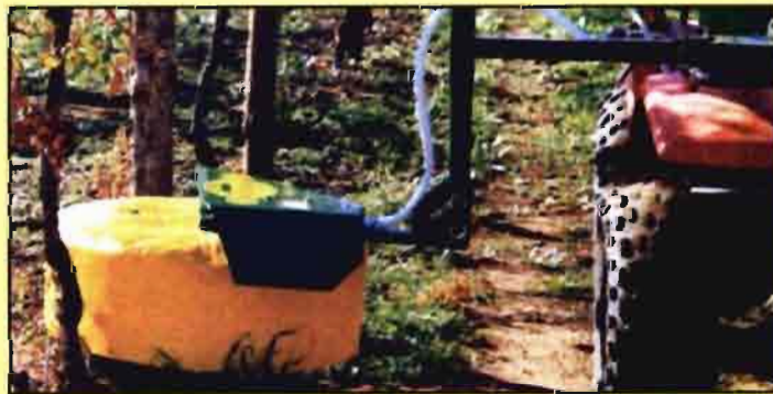
Fig. 7. Sistema de tratamiento de bajo volumen con cubierta protectora.