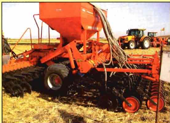
Fig. 3. Sembradora de chorrillo con tren delantero de corte de residuos.

ros de labranza vertical deben de alterar lo mínimo la cubierta. Los aperos más adecuados son los de labranza subsuperficial como los cultivadores de rejas en "V" de ala ancha o los pisadores de rastrojo, pero su uso en España está poco difundido y no están contrastados sus efectos.