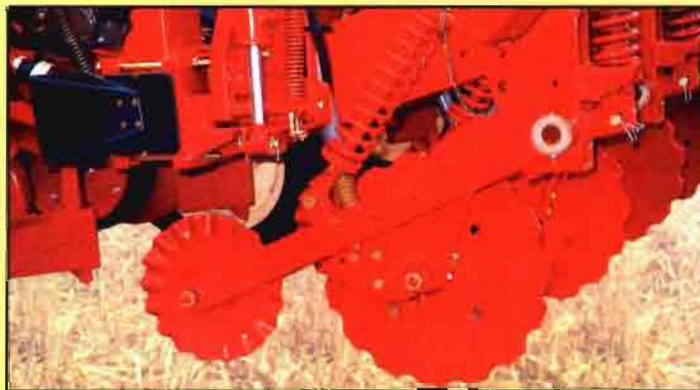
Fig. 2. Tren de corte de residuos.