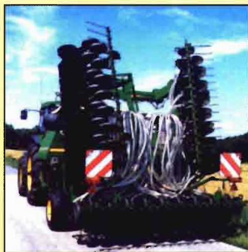
Fig. 5. Sembradora de gran anchura en transporte.

rectas a la inyección de abono aprovechando los discos de corte de residuos.