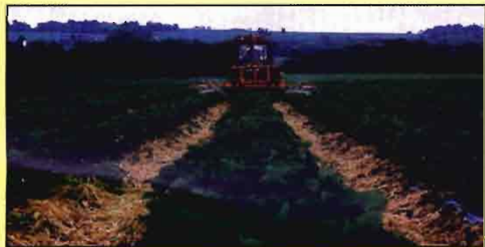
Fig. 6. Sistema de escarda entre líneas.