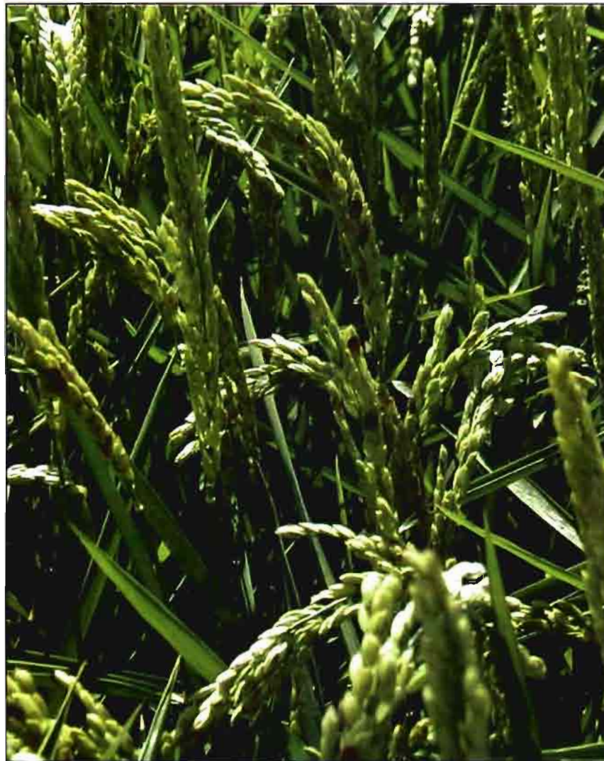
Manchas en espiga.