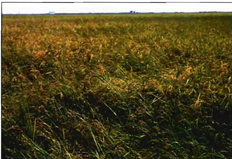
El arrozal valenciano se ha visto muy afectado por pyriculariosis en la última campaña.

En la campaña de 1999, la enfermedad con mayor presencia en el arrozal valenciano ha sido la provocada por Pyricularia oryzae , seguida de Helminthosporium , Alternaria y Fusarium . Según las muestras remitidas para su análisis al La-