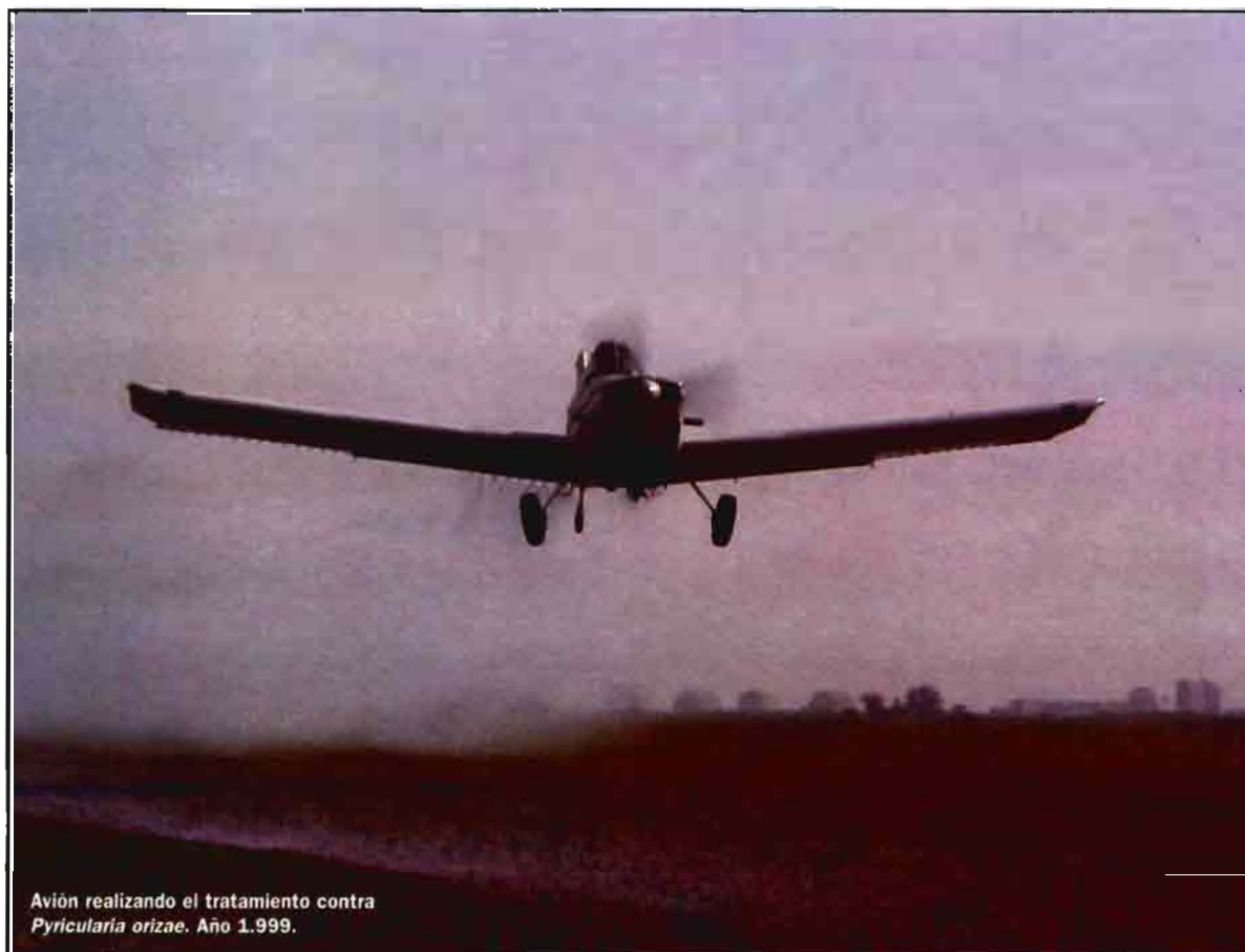
Avión realizando el tratamiento contra Pyricularia oryzae . Año 1.999.

mo tiempo, en cada una de estas zonas se instalarán cazaesporas para determinar la presencia/ausencia y el nivel poblacional del hongo. Una vez procesados todos estos datos, en el momento adecuado, se podrá dar los avisos de tratamiento para cada una de las zonas controladas cuando sobrepasen los umbrales críticos las condiciones meteorológicas y/o los niveles de esporas en el ambiente. De este modo, los agricultores afectados podrán realizar los tratamientos antifúngicos adecuados.