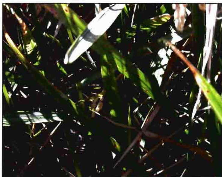
Ataques en hoja.