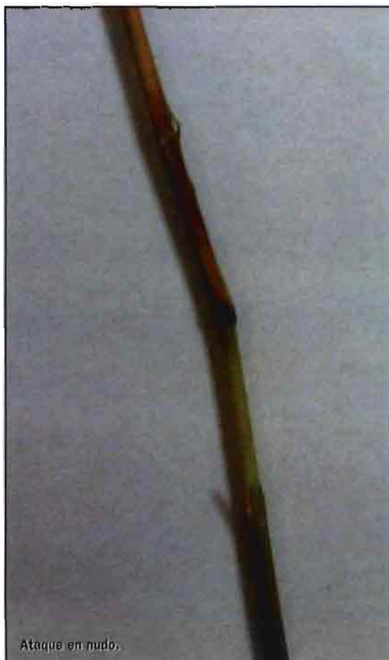
Ataque en nudo.

“ La pyriculariosis es la enfermedad más importante a nivel mundial de todas las que afectan al cultivo del arroz ”