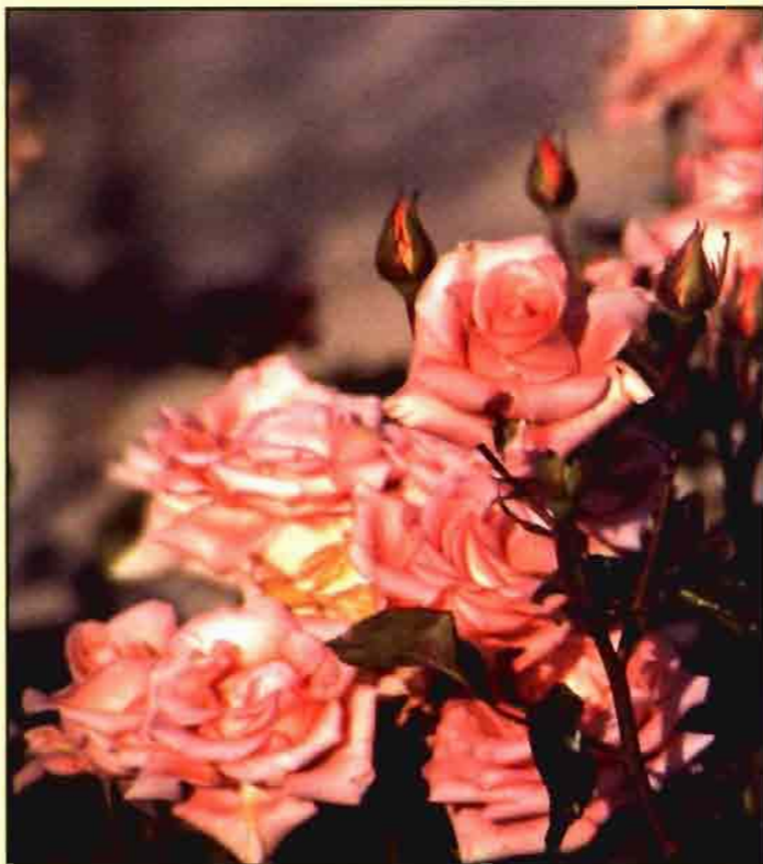
Las rosas constituyen una de las principales producciones del sector de la flor.

cortada. Este sector cuenta con un mercado floreciente para flor de "fuera de temporada", encontrando una gran demanda interior y también en los países comunitarios del norte de Europa.