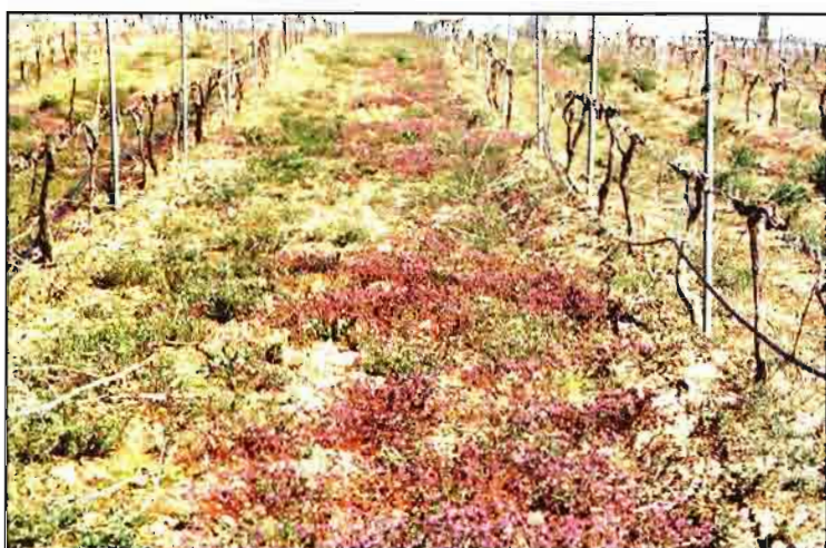
A finales de invierno se puede encontrar Lamium amplexicaule .