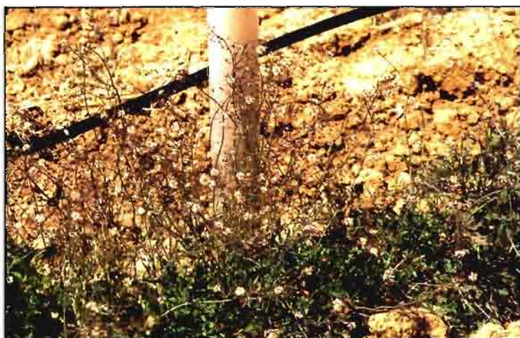
Capsella bursa-pastoris , una de las muchas crucíferas de la zona.