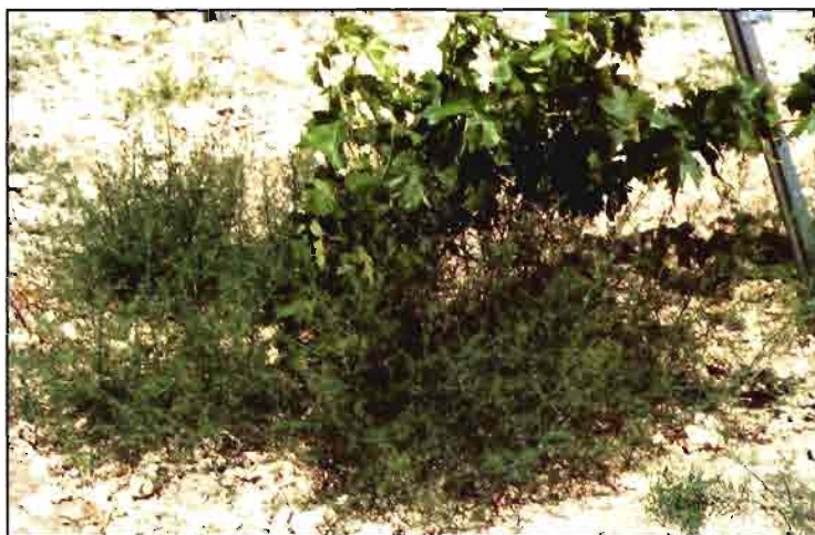
Una especie muy común y difícil de aislar es Salsola kali .

tos viejos sobre suelos franco arenosos, algo descuidados, pero generalmente esta especie no suele llegar a la floración debido a su fácil control mecánico mediante las primeras labores de cultivador.