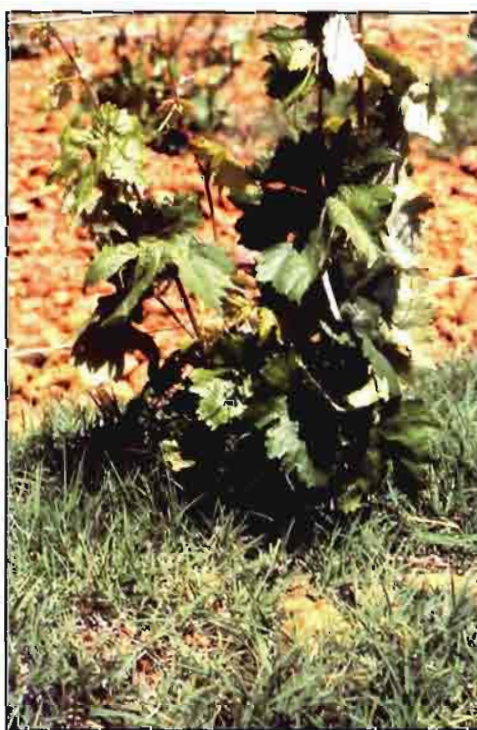
Cynodon dactylon , una de las vivaces más extendida.

Fumariáceas. Son muy frecuentes a principios de la primavera en los viñedos de la Ri-