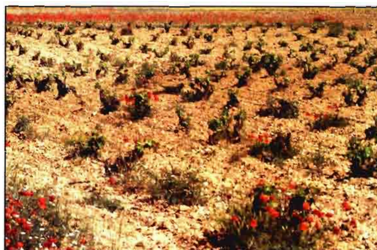
Papaver rhoeas , se controla fácilmente con herbicidas residuales o foliares.

único que consiguen es multiplicar su población. Por otra parte, el control químico, que en otros cultivos herbáceos es sencillo a base de clopiramida, en el viñedo está totalmente prohibido debido al alto poder toxicológico de estas formulaciones sobre la Vitis vinifera .