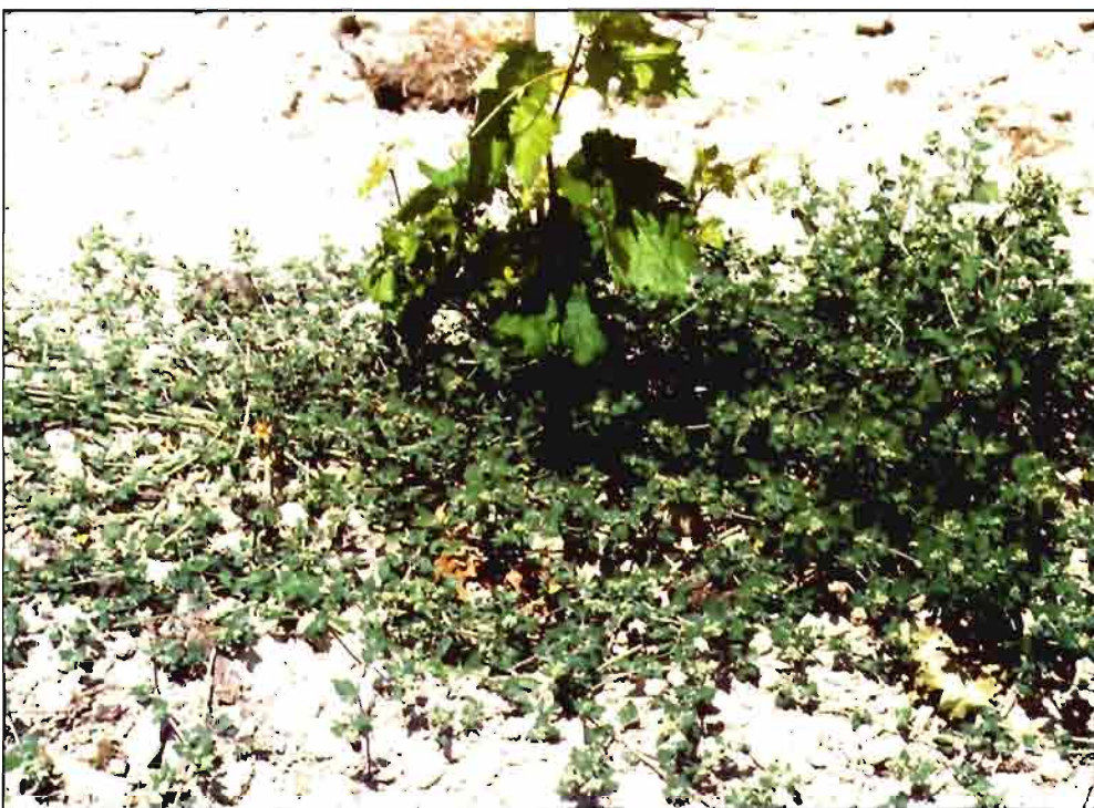
Chenopodium vulvaria , especie bastante extendida en la Ribera del Duero.

La más representativa es Arenaria serpyllifolia que se puede ver con frecuencia en va-