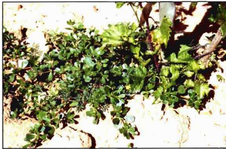
Portulaca oleracea , con poblaciones muy elevadas en zonas de la Ribera del Duero.

Leguminosas. Algunas especies de esta familia se pueden encontrar en los viñedos de la Ribera del Duero, pero sólo excepcionalmente sus poblaciones son tan importantes como para producir daños elevados las plantaciones. Estas especies se pueden eliminar con herbicidas residuales del grupo de las triazinas. Las adventicias más frecuentes