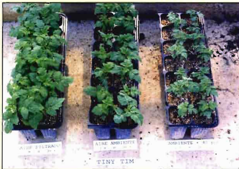
Daños en tomate según las concentraciones de ozono.

Viajar a destiempo en este compás supone asumir de que ya no se trata sólo de poner a punto tecnologías que permitan obtener productos con bajos niveles de residuos fitosanitarios, ni de