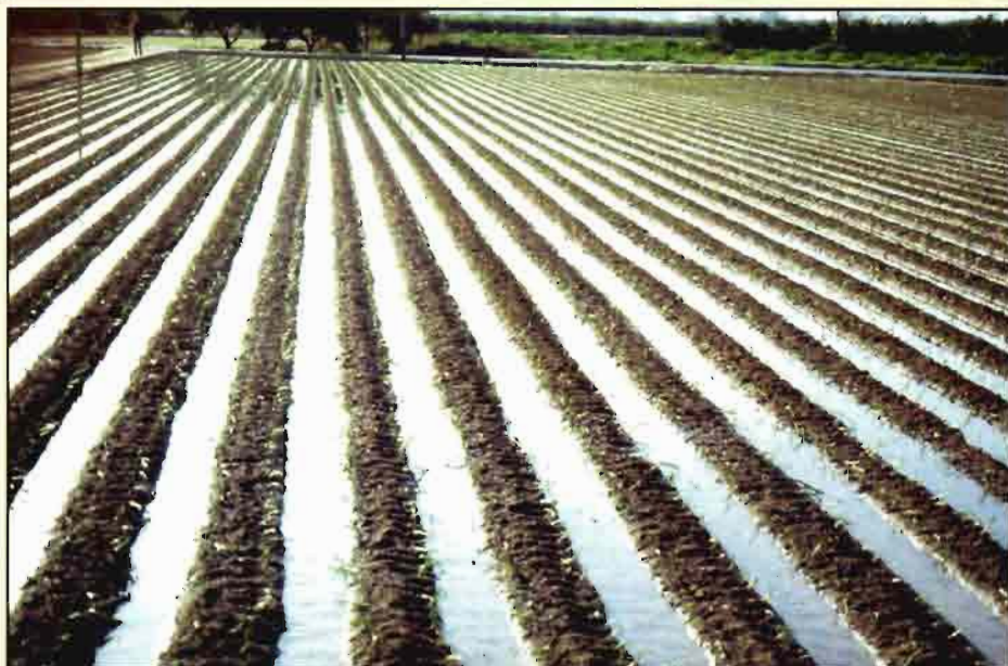
Los caudales de riego manejados por los agricultores valencianos evidencian el nivel y la capacidad de la cultura agraria mediterránea.

dad agraria una de las causas que pueden desencadenar estos procesos, cuando no se desarrolla esta actividad productiva con criterios agroecológicos.