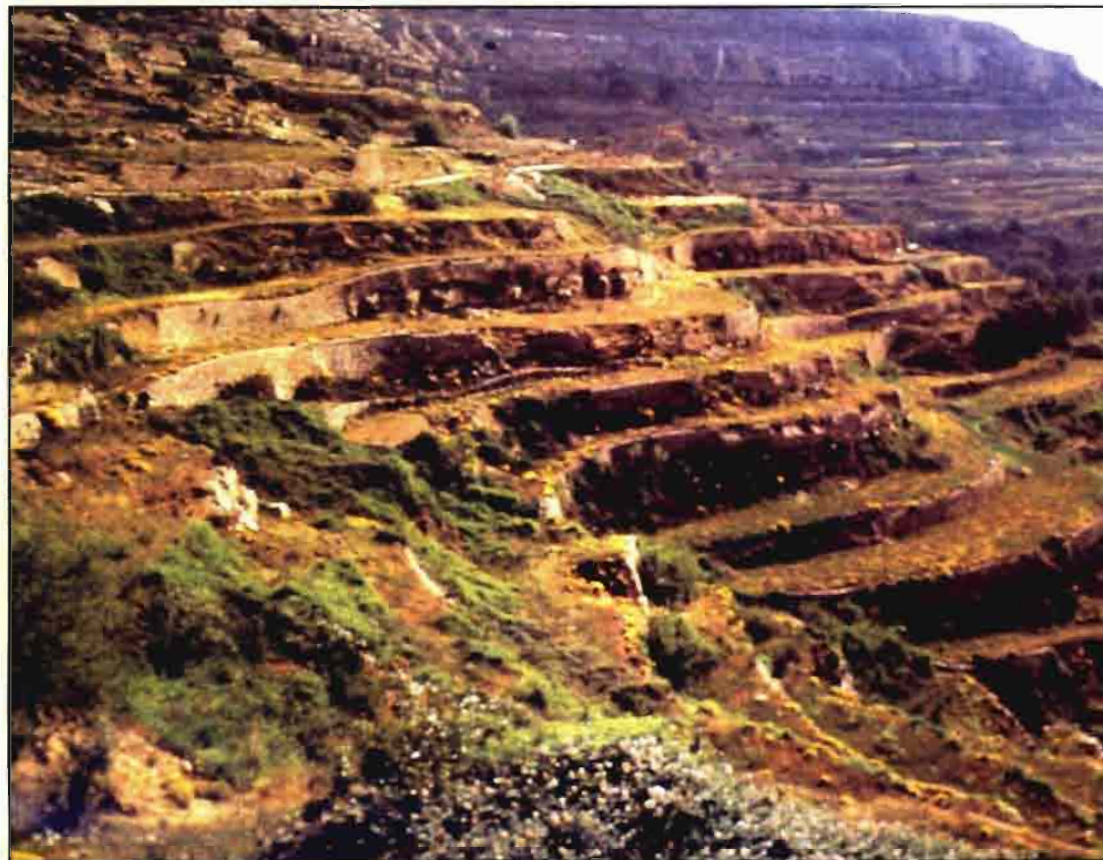
El abandono de terrazas como elemento de degradación del agrosistema mediterráneo.

El proceso por el cual los suelos empiezan a perder la fertilidad y la capacidad de albergar vida se llama desertización, y en ello pueden influir, tanto la proximidad de otros desiertos, como las propias operaciones que se desarrollan en el mismo suelo, siendo la activi-