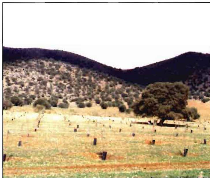
Tierras agrarias donde se está realizando un proceso de reforestación.

El valor cinegético de los terrenos se ve mejorado junto a la calidad ecológica y paisajística de la zona en cuestión, pudiendo consti-