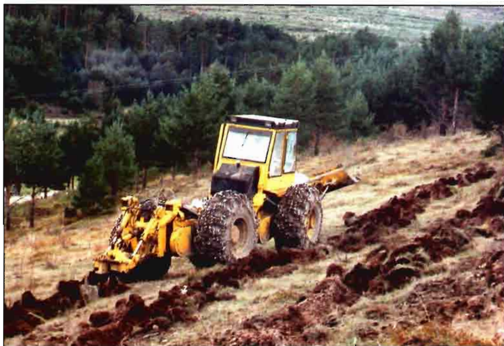
Maquinaria realizando labores para llevar a cabo la reforestación de este terreno.

ción agraria que quiera convertirse en empresario forestal, no tiene nada más que tramitar la solicitud de ayuda y, si ésta es aceptada, poner en marcha las obras y desde entonces se puede considerar "Empresario Forestal".